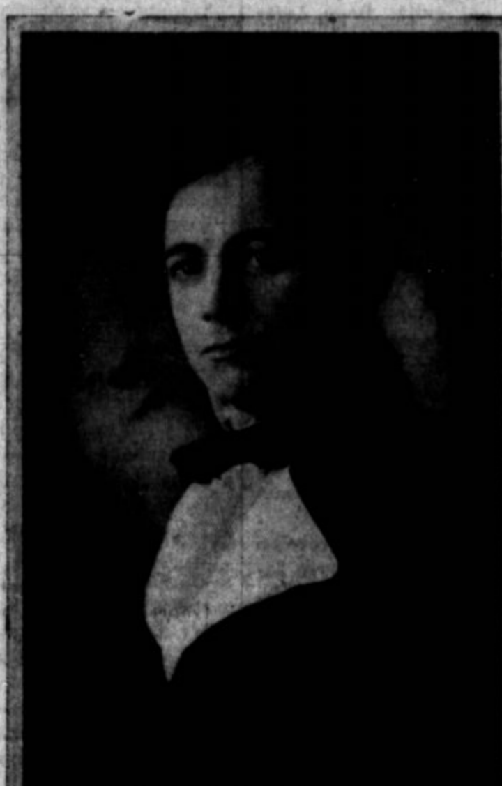
BANOVEC V "HOFFMANOVH PRIPOVEDKAH".

Bi radi knjige? Prečitajte cenik knjig v tej številki "Proletarca".