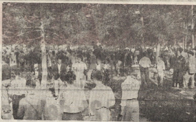
NA LJUDSKI VESELICI V TREBAH

Pristaniški delavci se zavedajo svoje sile in pravic od katerih ne bodo odstopili.