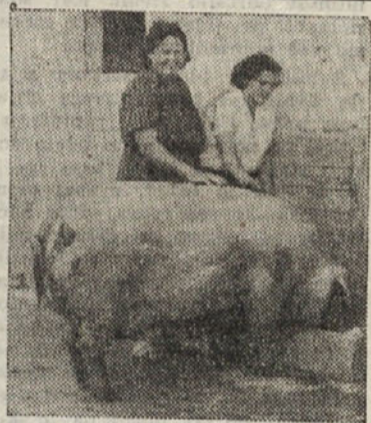
LEPA PLEMENSKA SVINJA

Topolove sadike lahko pridobivamo v drevesnici potom semena. Naj omenimo ob tej priliki, da rodi vsako drevo topola velikanske količine semena (10-20 milijonov!) in da se zaradi tega topol zelo rad širi na goličave, seveda, če so zato dani ugodni pogoji. Ker razmnoževanje s semenom v drevesnici nudi razne nedostatke, se bomo primerneje posluževali sadik. Ker razmnoževanje s semenom v drevesnici nudi razne nedostatke, se bomo primerneje posluževali sadik, ki smo jih pridobili na naslednji način: Ko smo zbrali lep topol zaželeno vrste (4-5 let starosti), odrežemo primerne ne pretanke in ne predebele veje. Vrbove vej in 30-40 cm dela veje v bližini stebila moramo odstraniti, ostalo vejo pa prerežemo na 25-30 cm dolge palčice. Tako pripravljene palčice posadimo v dobro pognojeno zemljo (15-20 cm globoko)