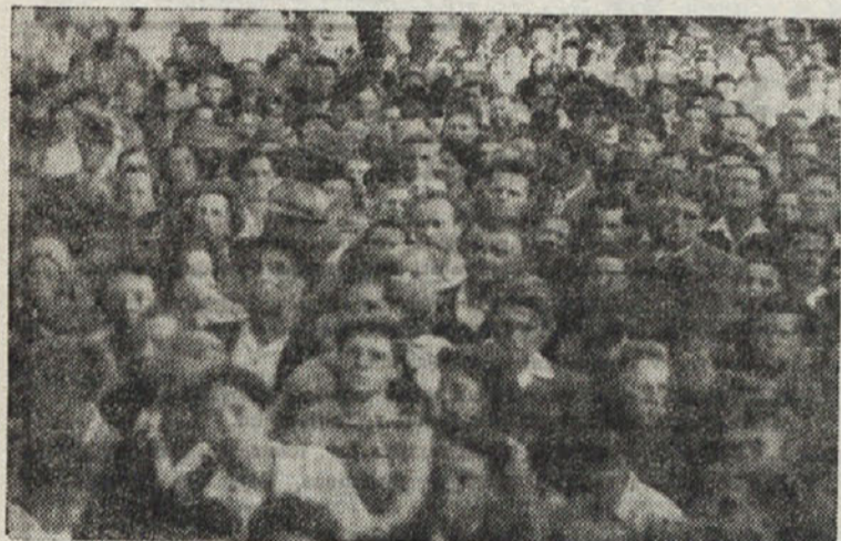
NA PROSLAVI V DOLINI

Ker so se pojavili nekateri slučajji tifusa, opominja odsek za zdravstvo pri okrožnem istrskem odboru prebivalstvo, naj se vsako sadje pred jedjo dobro opere, naj se ne pije vode iz vodnjakov, ki so v bližini hlevov, gnojišč itd., hrana naj bo dobro zavarovana, da je ne oblezejo muhe, ki so nevarne prenašalke raznih bacilov, mleko naj vre vsaj 10 minut. Snaga stanovanja in osebe pa je predpogoj za vsako zdravje in najboljše orožje proti nalezljivim boleznim.