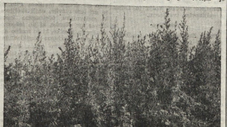
BUINO RASTE PELIN PO NASEM KRASU

Z gnojnico pa sadnemu drevju lahko gnojimo in sicer je najugodnejši čas za gnojenje z gnojnico zima ali pa prav zgodnja pomlad. Paziti pa moramo, da ni gnojnic pregosta, premočna, vsled česar je najboljše, da jo razredimo z vodo ali pa polijamo gnojnico takoj po dežju, ko je še zemlja razmočena. Vendar svetujemo gnojiti vedno z razredjeno gnojnico.