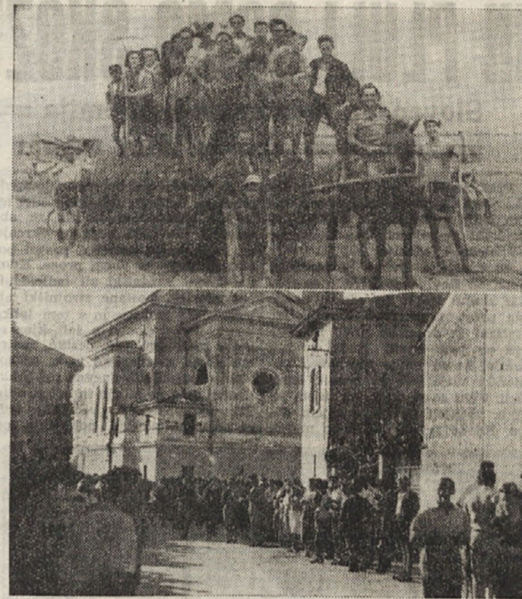
ZGORAJ — IZ MLADINSKEGA KONGRESA V STANDREZU SPODAJ — KMEČKA MLADINA SE PELJE NA KONGRES