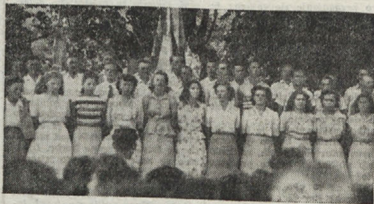
BEVSKI ZBOR V DOLINI

Vina bo več, čeprav bo nekoliko bolj šibko kakor preteklo leto.