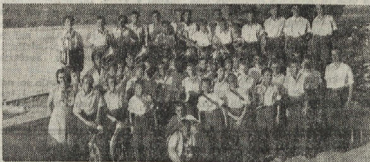
CLANI PIONIRSKÉ GODBE IZ SISKE

Tako smo videli, kako se je ta gospodarsko zaostala dežela izpremenila v veliko silo prvovrstno industrijo in naprednim kolhozom poljedelstvom. Na duhovnem področju je socialistična kultura, ki se je razširila v Sovjetski zvezi, kultura milijonov ljudi. Z njo se odpira novo obdobje v napredku človeške kulture.