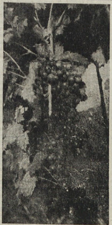
LEPO OBETA LETOS GROZDJE V ISTRI — DOVOLJ BO VINA

Klet naj bo pripravljena za sprejem novega vina. Iz nje odstranimo vso nepotrebno šaro. Čistoča je prvi pogoj kletarstva. Posoda, vinske, stiskalnice in sploh vsi pripomočki za trgatve morajo biti čisti in razkuženi. Ko je klet že dobro prečiščena, jo moramo še zažveplati, nakar jo prezračimo. Če je klet premrzla, jo moramo prezračiti le ob toplih urah.