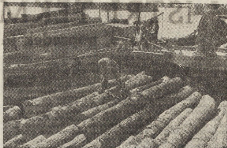
LESNA INDUSTRIJA V JUGOSLAVIJI

Mnogostransko delovanje poljskih sindikatov dokazuje, da so te sindikalne organizacije postale v kratkem času važen činitelj v družbeno-političnem in gospodarskem življenju dežele in da jim je uspelo pridobiti si zaupanje širokih delovnih plasti.