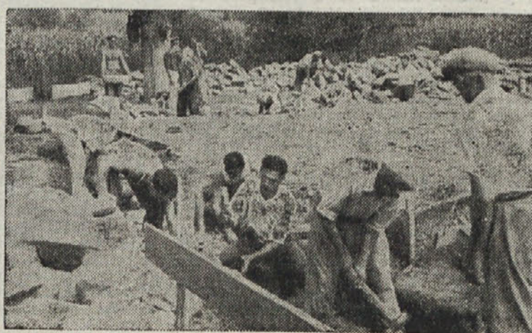
KMALU BO ZRASTEL ZADRŽNI DOM

Tako bodo zrasli zadržni domovi v Istri s pomočjo ljudske oblasti in sodelovanjem ljudstva samega. Zato bodo Istranom še bolj pri srcu.