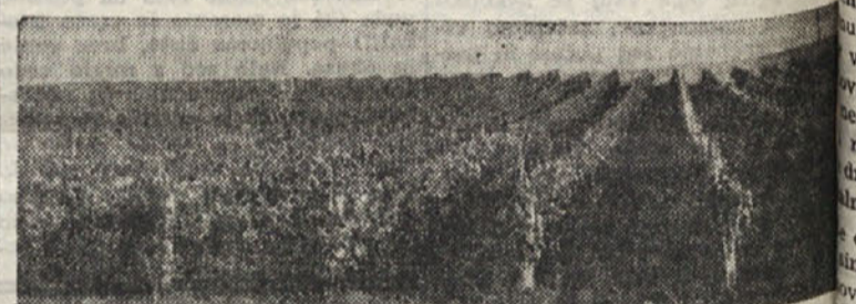
LEPI VINOGRADI V ISTRI

4. S prenašanjem čebel. — Nekateri čebelarji pomažejo pitalno koritce z medom, položijo ga zvečer na okno plemenjaka in ga čez nekaj minut, ko je koritce polno čebel, odvzamejo in takoj vtaknejo slabiču pod gnezdo. Mlade čebele ostanejo v novem domu, stare pa drugi dan odletijo v svoje prejšnje domovanje, ne da bi kaj žalega sto-