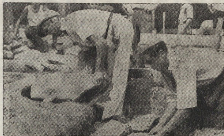
TEMELJNI KAMEN POLAGAJO

V Smarjah, Izoli, Gambočih, Momanu, Kaštelu, Buženiji, pri Sv. Ivanu, in Morinih so letos sezidali nove šole, ki bodo že z novim šolskim letom sprejele naše šolarje. Šole so lepe, sončne in pro-