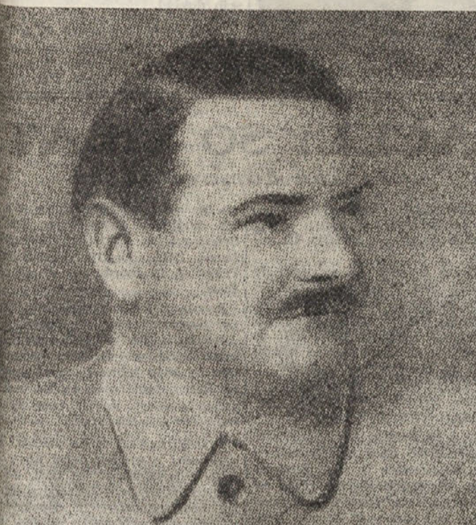
Andrej A. Ždanov Torek 31. avgusta je umrl A. A. ZDANOV, sekretar VKP (b), branilec Lenigrada, zvesti sodelavec Stalina, vztrajni bорец za zmago socializma.

«V teh težkih dneh, tovariši, smo v Vami, z vsem pošteno mislečim demokratičnim ljudstvom Primorja in prepričani smo, da bomo izšli iz te borbe še bolj prekaljeni in trdno povezani v srenejšo bodočnost. Naj živi naša borbena enotnost!»