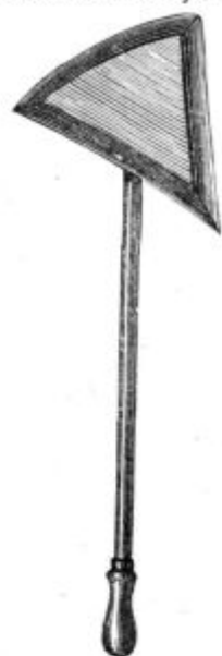
Pod. 8. Trivoglata str- gulja za sad. drevje.

Za čiščenje drevja mahu, lišaja in starega lubada služijo najboljše