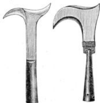
Pod. 6., 7. Nožu podobni str- guljici za sadno drevje.

Ostrgajmo mah in lišaj po sadnem drevju! Rastline di- hajo. One potrebujejo zrak, katerega sprejemajo v se skozi luknjice,