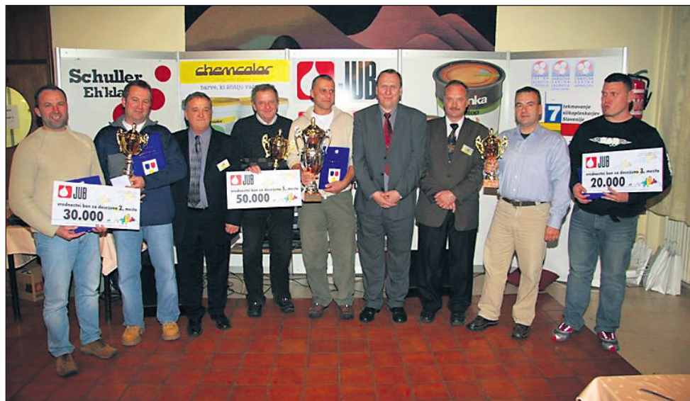
Zmagovalci sedme humanitarne akcije slikopleskarjev