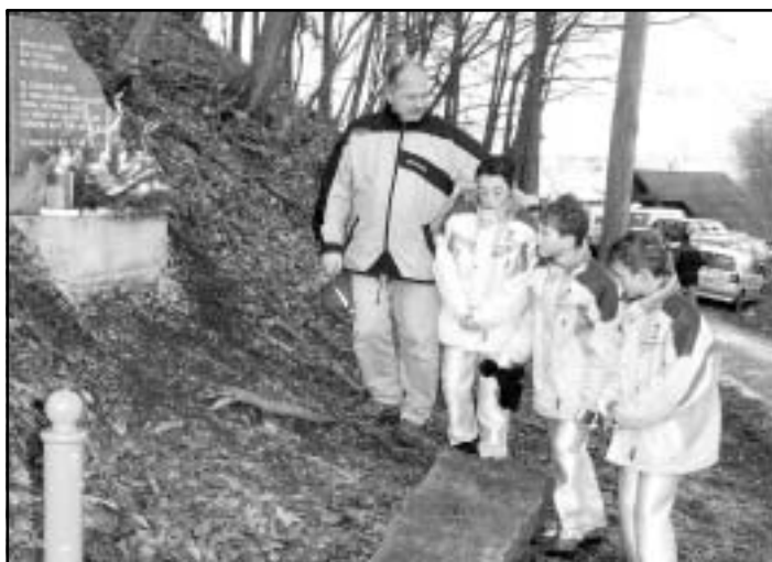
Polaganje cvetja na spominsko obeležje