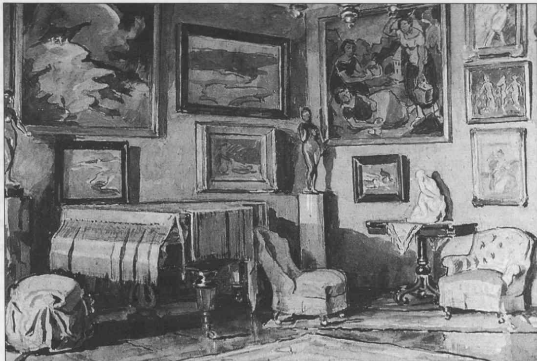
Slika notranjčine Grimščic izpred druge vojske.

Ali je bil čas propada Avstroogrške monarhije priložnost tudi za Slovence? To vprašanje je mnogo bolj kompleksno, kot se zdi na prvi pogled. Tudi ni to mesto pravšnje za takšne analize, a je vsekakor treba povedati, da je bil slovenski narod oziroma prebivalstvo na prostoru, kjer so živeli Slovenci s tisočletno vpetostjo v srednjeevropski kulturni prostor, katerega državnostna nosilka je bila dolga stoletja habsburška dinastija, usodno razdeljen na balkanski in srednjeevropski del.