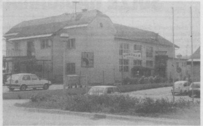
Kulturni dom krajevne skupnosti Hrušica-Fužine.

so sprejeli več statutarnih sklepov, razrešili vse dotodanje organe krajevne skupnosti in sklenili namesto skupščine imeti le 19-članski svet, ki bo izvršni organ zbora krajanov.