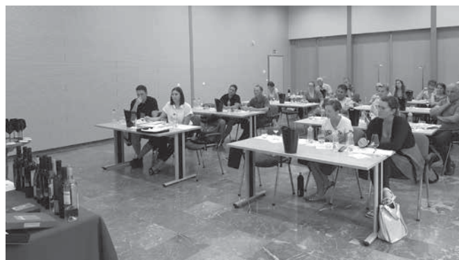
Udeleženci izobraževalnega modula »Sommelier ljubitelj«