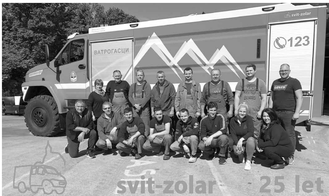
Zaposleni ob praznovanju 25-letnice