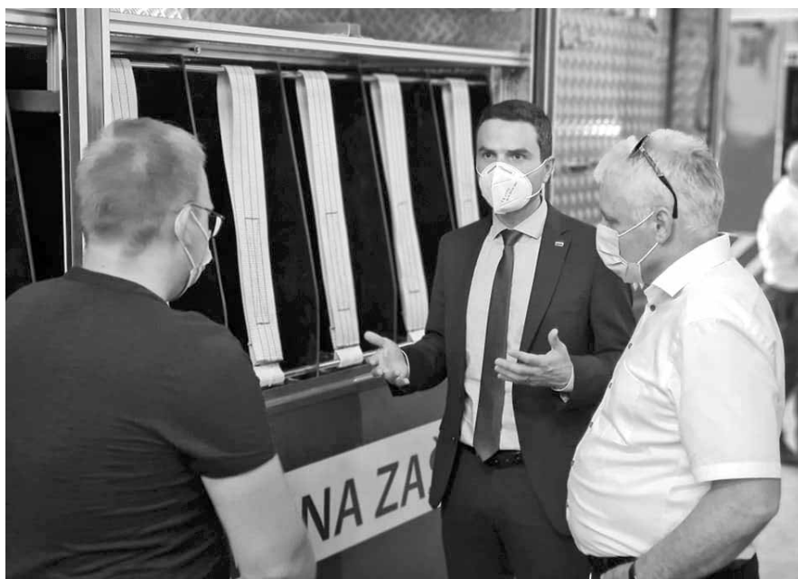
Obisk ministra mag. Mateja Tonina

Naslovna misel v resnici ne drži, uspešen podjetnik mora nositi svoje breme preteklosti, tistega dne in še jutrišnjega, preden si ga bo sploh naložil. Vztrajati mora tudi potem, ko so vsi že odnehali in nikoli videli cilja. Zgornjo misel je verjetno zapisal nekdo, ki se je le trdno držal za svoj stolček, mi pa dobro vemo, da temu ni tako.