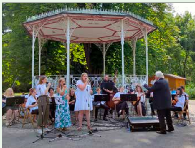
Tamburaški orkester v Mestnem parku Maribor