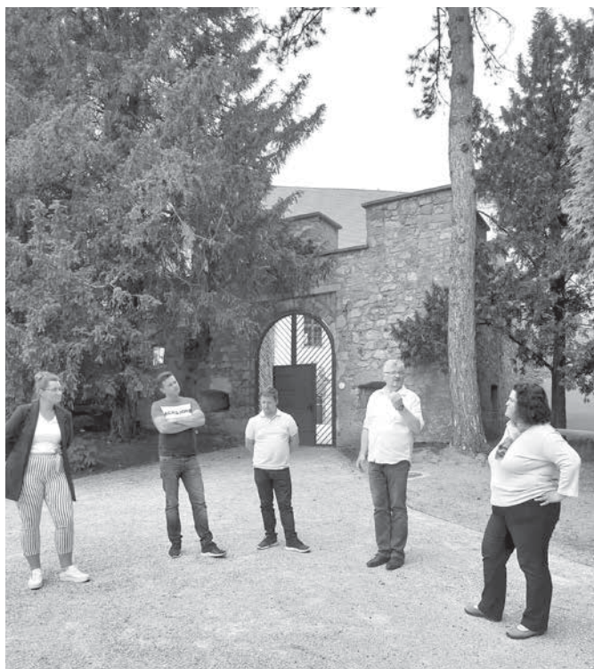
Udeleženci izobraževanja za turistične vodnike na gradu Borl.

V okviru projekta Razvoj turistične destinacije Haloze« in blagovne znamke Visit Haloze, v okviru katere sodelujejo haloške občine Majšperk, Žetale, Podlehnik, Cirkulane in Zavrč, smo v mesecu maju in juliju izvedli izobraževanje za turističnega vodnika Haloz in izobraževalni modul Sommelier ljubitelj.