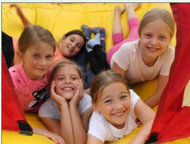
Otroška igrivost v Stopercah