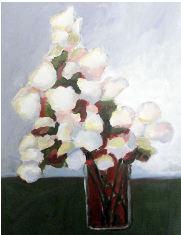
Tamara Špitaler Škorič