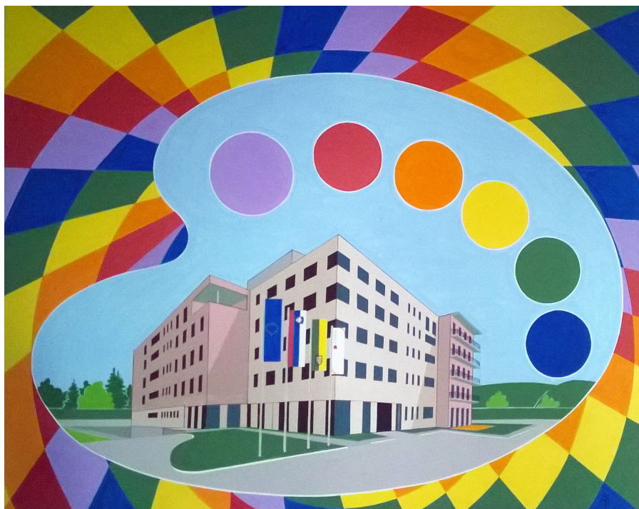
Filip Matko Ficko

BASEN (v verzih ali v prozi) ∞ ÁLLATMESE (versben vagy prózában)