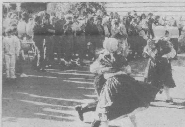
Za ogrevanje je po taktih ansambela Delta najprej zaplesala folklorna skupina iz OŠ Jože Moškrič.