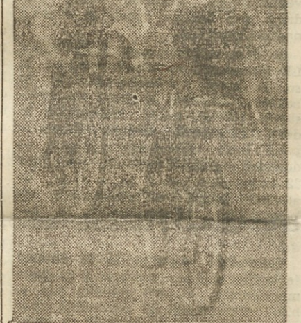
Tudi dež jih ne moti!

Dokaj truda bo zahtevala bližajoča se mednarodna etapna kolesarska dirka po Hrvatski in Sloveniji, ki bo od 28. avgusta do 4. septembra. Da bi se za napore naši slovenski dirkači čim temeljiteje pripravili, je Fizkulturna zveza Slovenije omogočila kandidatom 14dnevni trening v Kranjski