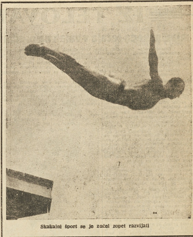
Skakalni šport se je začel zopet razvijati