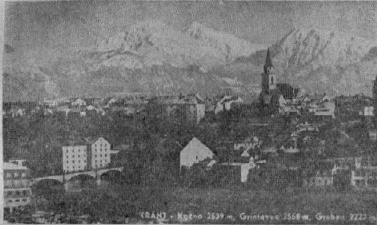
Mesto Kranj na Gorenjskem

"Hitler je vstupil hrvaškemu narodu za kralja svojega vazala, italijanskega vojvode de Spoleta, brata vojvode d'Aoste, tistega, ki se je pokazal za popolnoma nesposobnega poveljnika laške vojske v Abesiniji. Ta "kralj" sedi lepo v Rimu, ker se boji iti na Hrvaško. V Hrvaški je Hitler našel propalega zločince Pavliča, ki mora le izvrševati naredbe svojih nacijskih gospodarjev. Na deset tisoče in deset tisoče najboljših sinov hrvaškega naroda mečejo v koncentracijska taborišča. Na stotine, da na tisoče najhrajših hrv. boriteljev je ustreljenih ali obesjenih. Da bi Hitler dosegel te svoje zle cilje, si s pomočjo svojega pandurja Pavliča prizadeva razpaliti narodno neslogo