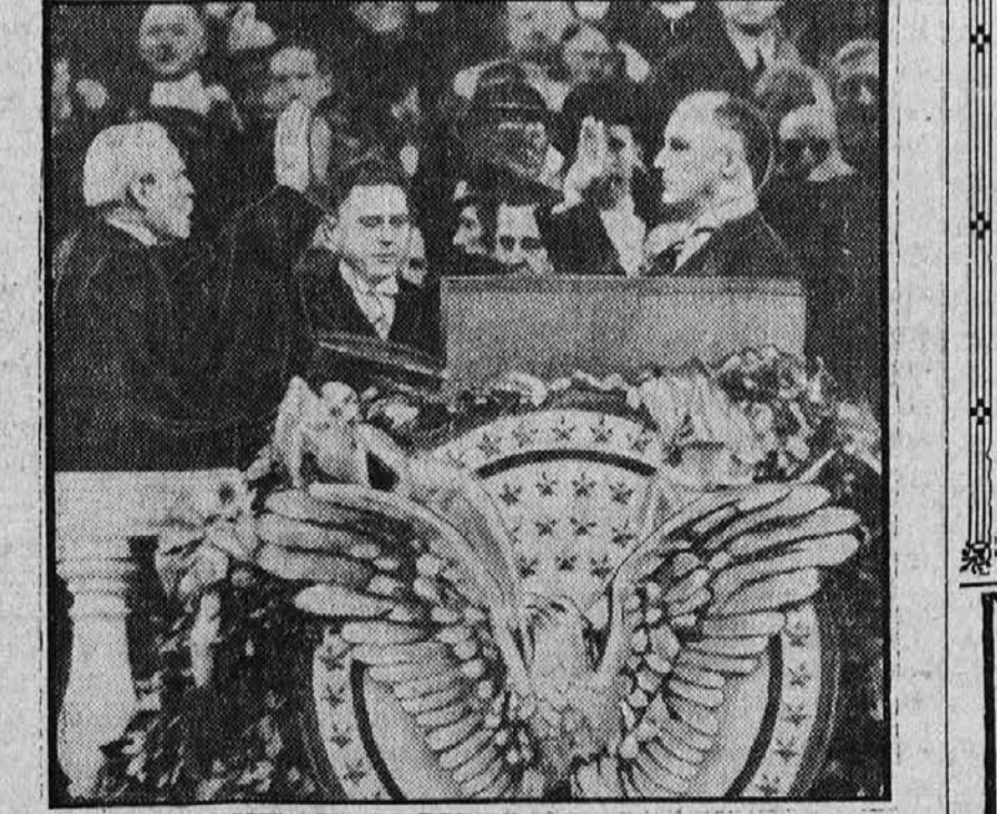
Slika iz inauguracije predsednika Roosevelta 4. marca 1933, ko je bil zaprisežen kot predsednik Zed. držav. Zaprisegel ga je predsednik najvišjega sodišča Zed. držav, Charles Evans Hughes. Tudi letos ga je zaprisegel sodnik Hughes.

"Hm!" je dejal svetnik in se sklonil naprej, "nevarna igra! Enkrat se ta sleparija vendarle razkrije in kredit je fuč!" "Čemu neki?" je ugovarjal Jack zmagovito.