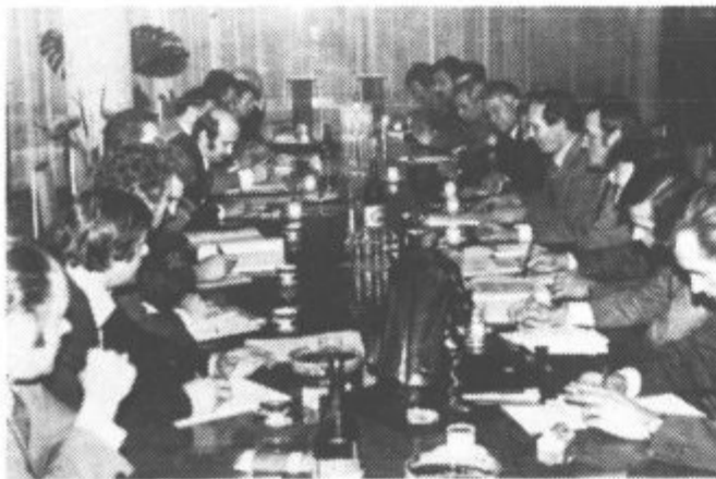
Sredi večurne razprave na Rudarsko elektroenergetskem kombinatu

Politična aktiva Gorenja in Rudarsko elektroenergetskega kombinata Velenje sta med večurnim pogovorom spregovorila o številnih nalogah, ki so pred družbenopolitičnimi organizacijami, samoupravnimi organi in obema delovnimi kolektivoma v zvezi z uresničevanjem vsebine zakona o združenem delu, o čemer bomo podrobneje pisali v prihodnji številki Našega časa. —M.