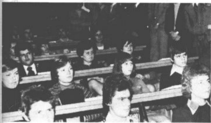
Občinska organizacija Zveze komunistov je bogatejša za 114 novih članov