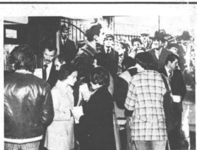
V knjižnici Kulturnega centra so obogatili oddelek marksistične in družboslovne literature z novimi knjigami in slikami.

Delegacija komunistov in partizanov iz Italije je med bivanjem v Saleški dolini obiskala tudi več delovnih kolektivov pri nas, ogledala si je kulturne znamenitosti mesta, bila je na predstavi amaterskega gledališča ter sodelovala na svečani razširjeni seji komiteja Občinske konference ZK. M.