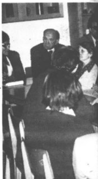
Komunisti iz Šmartnega in Komunista, na katerega so politkomiteja za vzgojo in izobrazbo Zbranim komunistom je govorec

Podobna slovesnost je nato sledila še pred spomenikom revolucionarja, legendarnega borca in pesnika Karla Destovnika Kajuha, kjer je venec položil Filip Lesjak. VITO KUMER