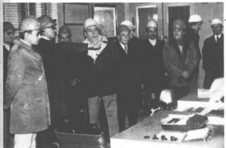
Delegacija Komunistične partije Italije na obisku v termoelektrani Šoštanj.

Ob tej priložnosti so izdali tudi pregleden katalog, v katerem je seznam vse literature. Izposojanje marksistične in družboslovne literature je brezplačno.