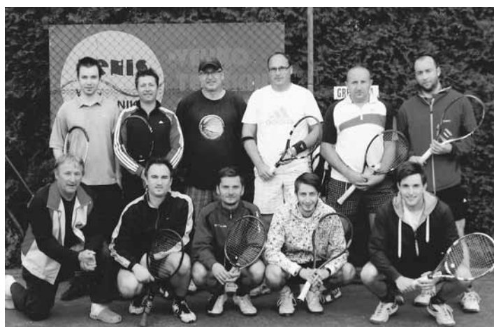
Teniški klub Destrnik