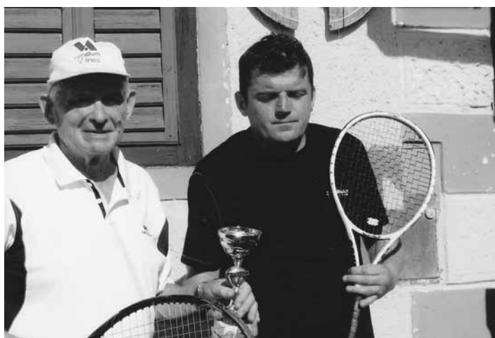
Teniški klub Destrnik