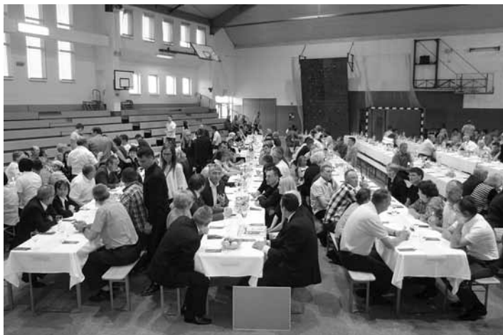
Osrednja slovesnost je potekala v športni dvorani na Destrniku

Prireditve ob 16. občinskem prazniku Občine Destrnik so potekale od sobote, 17. maja, do nedelje, 1. junija. Osrednja slovesnost je potekala na predvečer farnega žegnjanja v soboto, 24. maja, v športni dvorani na Destrniku.