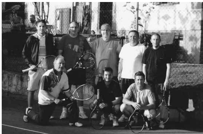
Teniški klub Destrnik