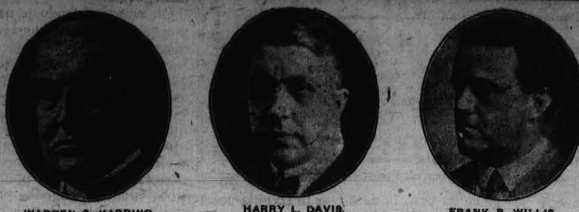
WARREN G. HARDING, za predsednika