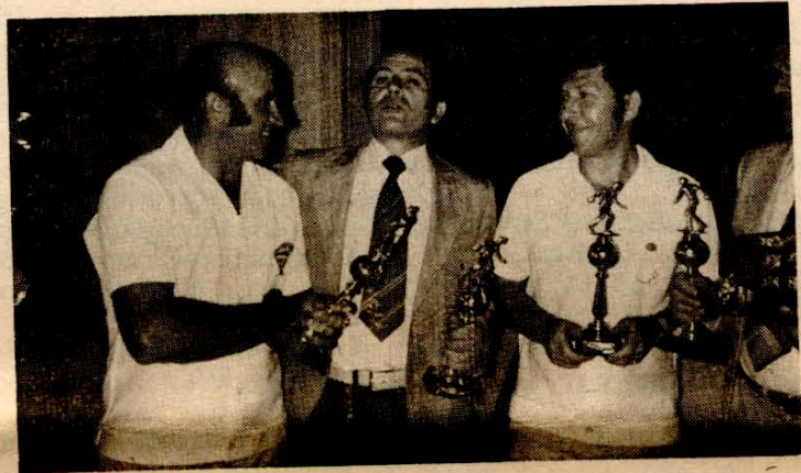
Veseli zmagovalci s trofejami

Ker je bil podpis pogodbe nov mejnik v naporih za našo skupno stroko, in sicer za namembnemu dogodku prisostvovali vsi člani klubskega odbora.