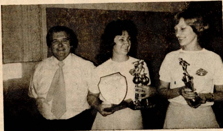
Ald. D. Turtle z Emo in Ivico

V sredo 25. aprila so košarkarji Triglava v Bankstownu pozdravili igralce zagrebške CIBORNE in jim v spomin izročili triglavsko značko in lesorez Cankarjevega spomenika na Triglavu.