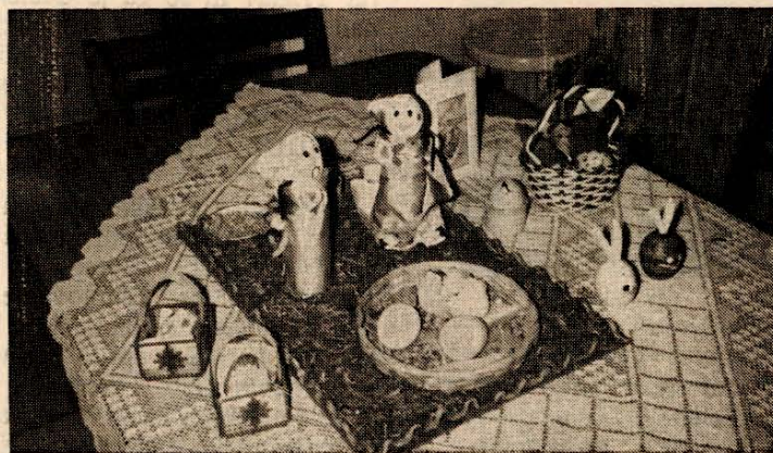
Pirhi naše mladine (I. Mezgec)

Moja mama je zelo dobra zame. Tudi drugim rada pomaga. Doma dela; kuha, pere, pomi va posodo, lika, pometa pa še drugo