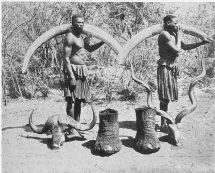
Prebivalci afriških pragozdov; slonovi zobje, noge; rogovi od bivola in antilope.

Danes zjutraj smo že ob 4 mogli ločiti v polmraku na trgu pred cerkvijo postave vrlih zamorcev, ki so se