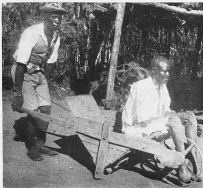
Misij. sluga pelje ubogega gobavca v samokolnici k sv. maši.

„Šole pri sv. Klemenu še nismo mogli dozidati. Je pa tu 50 otrok, ki bi radi hodili v šolo in bi jih mogli daleč proč od mesta in hrupa temeljitejše vzgojiti in bolje in globlje poučiti o vsem potrebnem. To malo, kar smo