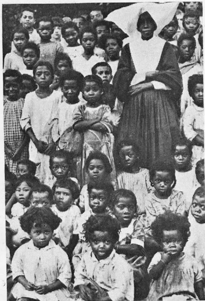
Sestra-zamorka z ubogimi sirotami, Zamorčki hvaležno molijo za dobrotnike, ki so pomagali, da so zamogli biti sprejeti v misijon.

oskrbujejo po svojih najboljših močeh, čeprav ni upanja, da bi ozdraveli. Toda duša je rešena za nebesa. Ah, ko-