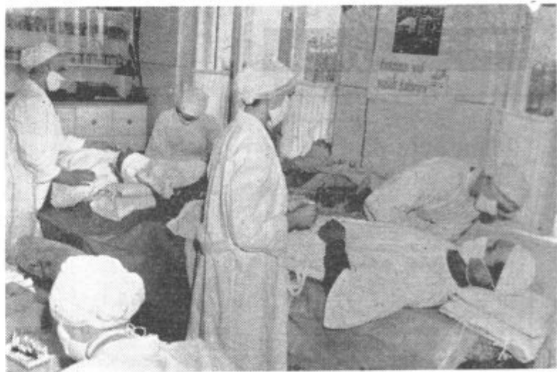
Odvzem krvi v ZD Lenart — Tržani neradi dajejo svojo kri. Kako to?