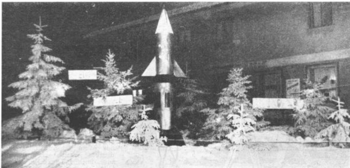
PRED NOVIM LETOM SO ZLASTI TRG LENART LEPO UREDILI. TRGOVSKO PODJETJE »POTROŠNIK« IZ LENARTA JE MED SMREKAMI POSTAVILO VELIKO RAKETO (NA SLIKI), MEDTEM KO JE GRADBENO PODJETJE UREDILO MANJŠO HIŠICO V KATERI SO PRODAJALI SLADKARIJE ZA NAJMLAJŠE.