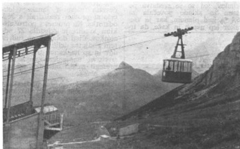
Z žičnico 2950 metrov visoko v Dolomitih.

svoje prispevati tudi prosvetno društvo. Prav tako ne bomo smeli odlašati s sestavo orkestra, ki naj bi ob sobotnih večerih igral v domačem gostišču. Verjetno bi tak zabavni orkester bilo mogoče sestaviti iz godbenikov bivše godbe na pihala s pomočjo glasbene šole. Za slednje bo moralo bolj skrbeti tudi gostinsko podjetje.