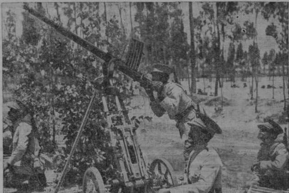
Topovi za obstreljevanje letal v Abesiniji.

Pozdravi iz Zagreba. Prejel sem te dni zelo ljubeznivo pismo iz Zagreba. Bolj srčne besede so bile pisane celo rdeče, menda s srčno krvjo. Reši pa moram, da je pismo zelo pametno: Pravi, da mora vsak Slovenec sprejeti načelo, da naj Hrvati rešujejo hrvaško vprašanje in naj jih Slovenci ne motijo, pač pa naj se brigajo za sebe! Tudi mi je pismo povedalo, da se Hrvati najbolj bojijo, ako bi vlada izdala zakon o samoupravah, da bi bila tako tudi Hrvška samoupravna. Seveda, tedaj se neha teater, pa se začne delo. Grdo pa zdela tiste