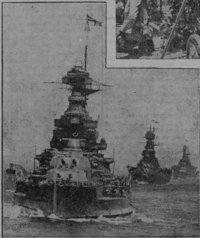
Ena največjih angleških križark »Valiant« s 33.000 tonami je priplula v obrambo angleških koristi v Sredozemsko morje. Zada vidimo na sliki križarki »Hood« in »Renown«.