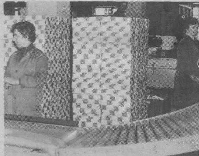
Za pozitivni rezultat so odgovorni vsi. Delavke v večški papirnici ob stroju za rezanje papirja malih formatov. CZ

Lani so prevozili vlaki na območju ŽG Ljubljana za 1,6% več kilometrov kot leto dni poprej, pri čemer so se zmanjšale zamude potniških vlakov za 1,6%, v tovornem prometu pa so se povečale za 10,5%. Vseh izrednosti in motenj železniškega prometa