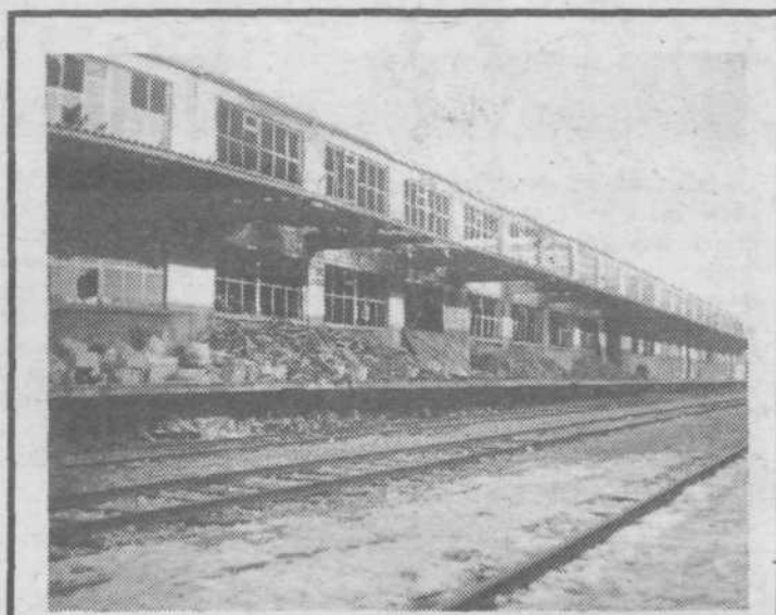
Takole je bilo videti skladišče Centromerkurja dan po požaru

Na podlagi tržne vrednosti zemljišča se izračuna višina mesečnega prejemka — preživnina. dipl. inž. agr. BOŽENA PUGELJ