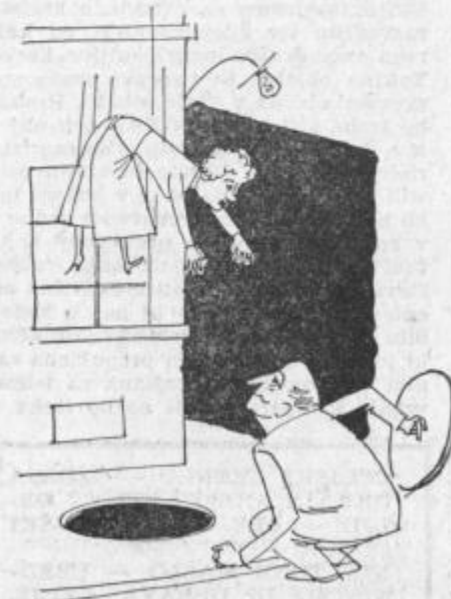
Brez besed ...

POLITIKA MED OTROCI ... —Veš, Peter, če bi vedel, da bo oče res ostal popolnoma nevtralen, bi ti prilpil tako zausnico, da bi ti zvonilo po ušesih! —