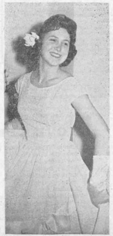
Slička z maturantskega plesa v Celju, ki je po vsej pravici postal tradicionalen. To je ena izmed mnogih, ki bo letos sverjetno z uspehom zapustila srednješolske klopi. In kdo je ta lepota? Uganite sami!

Lani v novembru je začelo večerno tečaj esperanta petindvajset tečajnikov. Pouk je dvakrat tedensko pod vodstvom učitelja-predavatelja Inkreta. Med obiskovalci je nekaj uslužbencev, obrtnikov, delavcev in dijakinj. V mesecu marcu bodo v Šoštanju ustanovili esperantsko društvo.