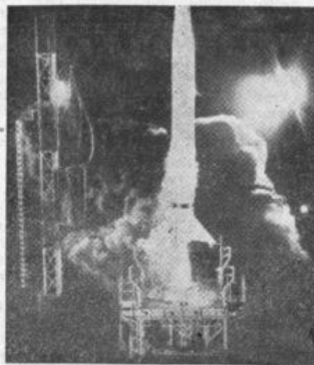
Tokrat je šlo ...

programa za nadaljnje osvajanje vesolja. Po njegovi izjavi kroži »Raziskovalec« normalno okrog Zemlje, skozi najvišjo in najnižjo točko 2720 in 320 km. Satelitova pot ne vodi čez sovjetsko ozemlje, moskovski radio pa je javil, da so v Taškentu ujeli njegove signale.