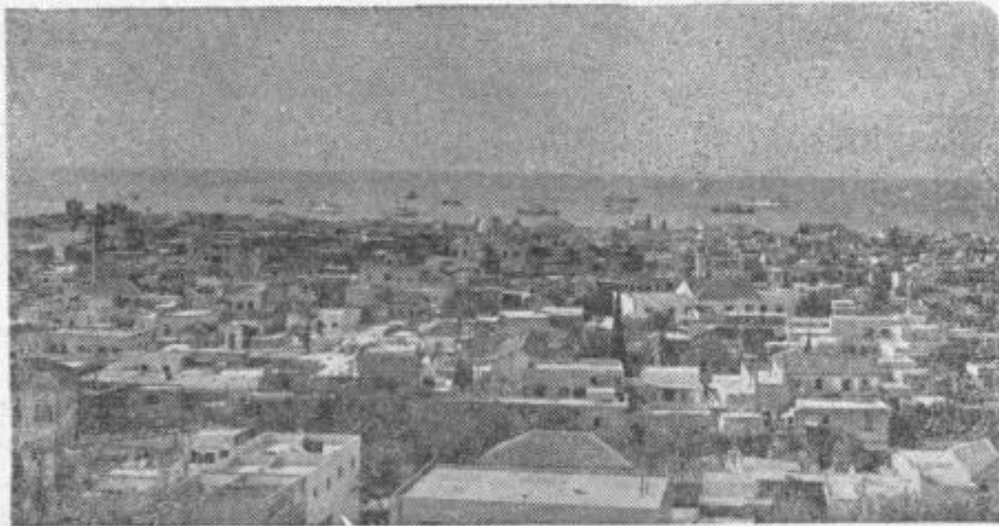
Sirijsko pristanišče Latakija

Šteje okoli 4 milijone prebivalcev, predvsem Arabcev, ima pa nebroj narodnostnih manjšin; Turke, Kurde, Cerceze, Armenice in Perzijance. Tudi zgodovinska preteklost je pestra. To ozemlje so pred našim štetjem držali Asirci in Babilonci, pozneje Heleni, Grki in Rimljani, potem dolgo vrsto let Turki in po prvi svetovni vojni je bil Levant, tako imenujemo ves prednji del Sred-