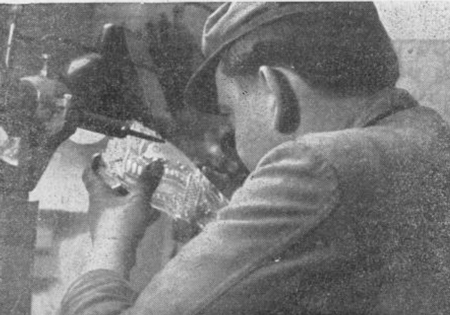
Kdorkoli opazuje kristalno vazo, jo občuduje. Malo pa je tistih, ki pomislijo na stotine ur in jo izoblikovati po idejnih načrtih. To so mojstri stekla in njih sloves gre še daleč preko naših meja, kjer občudujejo njihov čut in smisel za lepoto.