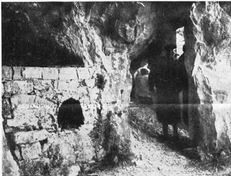
Na sliki vidimo krušno peč, ki stoji ob vhodu znamenite Landarske jame, ki je bila, kot pravi legenda, zatočišče slovenske kraljice Vide, ko so vdirale Atilove horde v naše kraje. O tem piše tudi pesnik Anton Aškerc

1262. Z obmejnimi propustnicami in dvolastniškimi izkaznicami je bilo 14.682 prehodov. Največ prehodov je bilo v Štupci in sicer 10.720. Skozi druge prehode pa je bil takle promet: skozi Rodedišče 1118; skozi Solarje pri Dreki 728, Čepatišče 549. Most na Nadiži v tipanskem komunu 464; skozi Učjo 223; Most Mišček 375; Most Klinac 221; skozi Kau 108; skozi Teleferiko pri Dreki 88 in skozi Melino v Idrijski dolini 90.