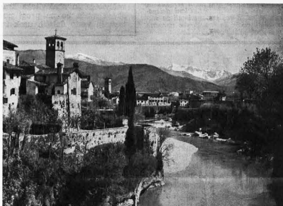
Una bella visione di Cividale dove ogni sabato convergono al mercato gli sloveni della vallata del Natisone e dell'Isonzo.

Date quindi il vostro voto a uomini di vostra piena fiducia, a uomini che, oltre ad offrire le maggiori garanzie di onestà e di capacità, amino veramente la vostra e la loro terra e la sua storia scritta da uomini di grande ingegno e di grande fede e oltremodo fieri di sentirsi suoi figli.