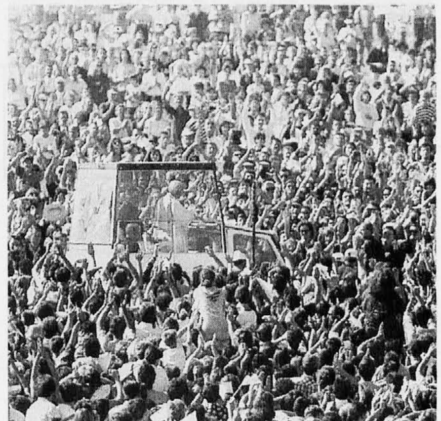
Sv. oče na zagrebškem hipodromu