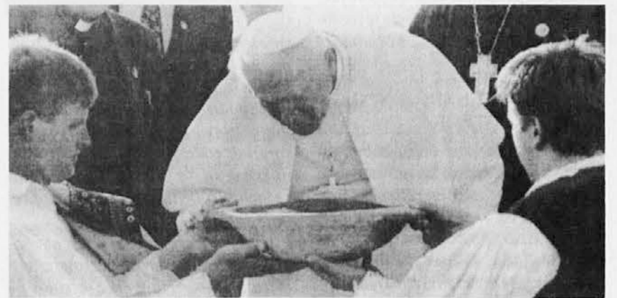
Papež poljublja hrvaško zemljo

Hrvaška Cerkev je poklicana prav v znamenju hvaležnosti za veliko milost zgodovinske zvestobe Cerkvi, da postane apostol obnovljene sprave. Vera naj ponovno postane v teh predelih združevalna sila. Napredek in blaginja držav slonita le na miru.