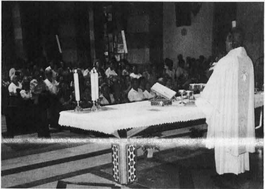
Pomožni škof Uran daruje sv. mašo