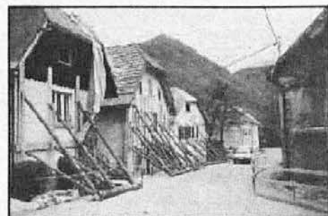
Obnova Tolmina se je pričela...