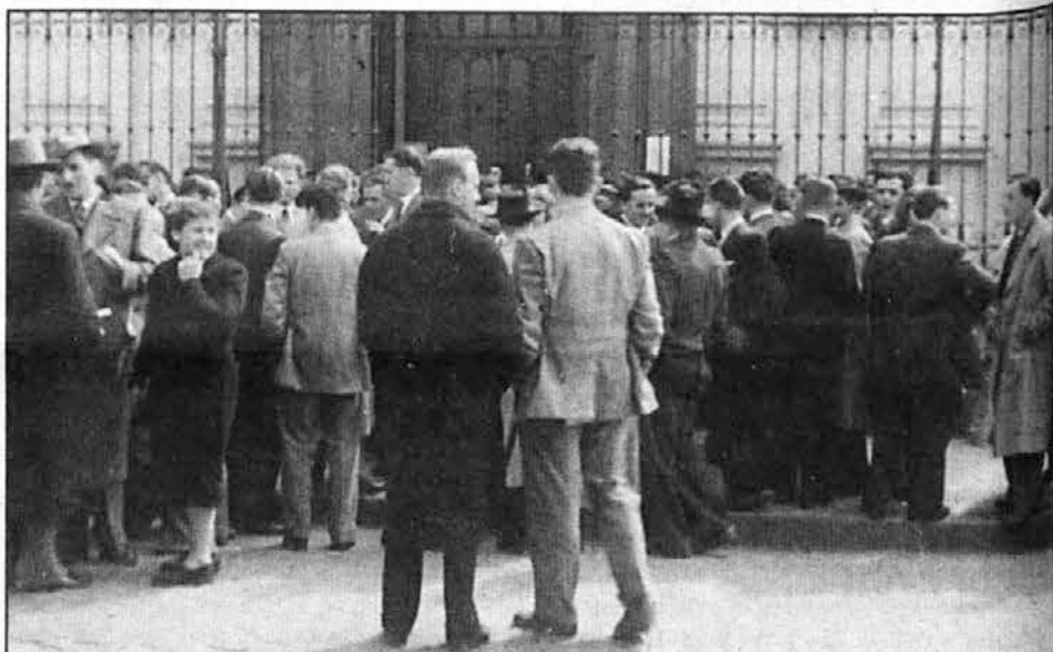
Slovenski izseljenci se zbirajo po maši pred cerkvijo leta 1948.