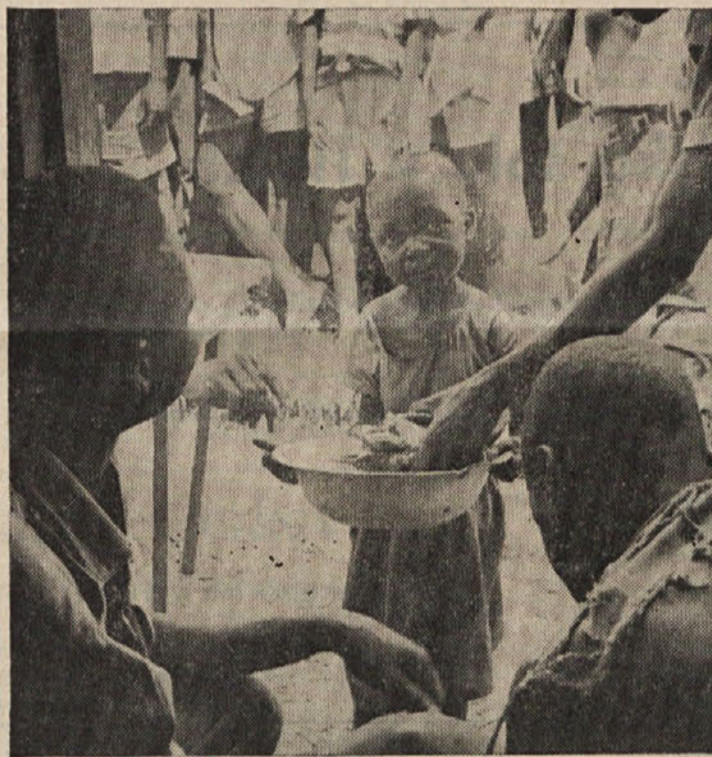
Lakota zopet grozi prebivalstvu Konga, čeprav je živil zadosti na razpolago zaradi darov iz vsega sveta. Med tem ko se v Leopoldvillu in pristanišču Matadi kopičijo zaloge živil, pa osrednja vlada nima moči, da bi organizirala prevoz v notranjost, potem, ko so čete Združenih narodov te transporte odklonile z utemeljitvijo, češ da ima kongoška vlada itak dovolj lastnih vozil na razpolago. Te pa uporablja kongoška vojaščina za brezsmiselno prevažanje vojakov, orožja in piva. Slika kaže delitev hrane otrokom pri kuhinji neke ameriške dobrotelne organizacije.

Celo strogi apostol Pavel priporoča Timoteju: »Ne pij več samo vode, ampak vino.«