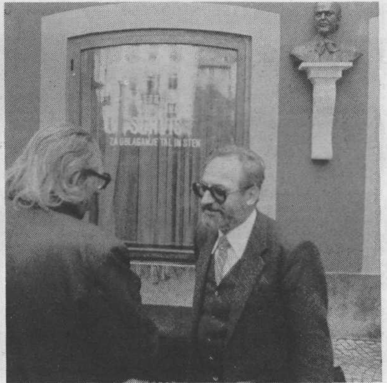
Srečanje treh pisateljskih generacij: Josip Jurčič, Ivan Mrak in Tone Pavček.