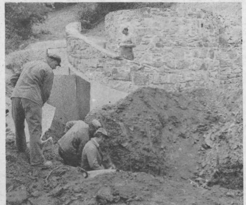
Na drugi ploščadi otroškega igrišča na Osojah bo zgrajena lična stavba s sanitarijami. Prvotni obrisi »grajskega sloga« zidave so že vidni.