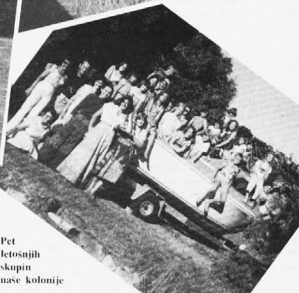
Pet letošnjih skupin naše kolonije