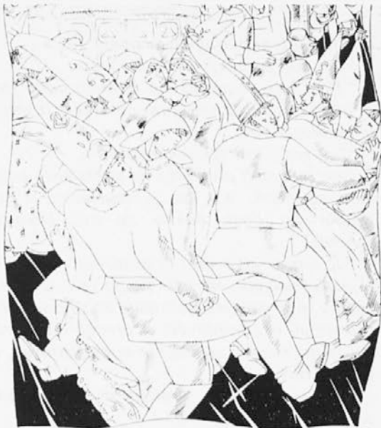
France Kralj: Pust

A čim smo odprli podstrešna vrata (ker ondi smo se šemili) — že je spodaj nekdo prihajal po stopnicah navzgor.