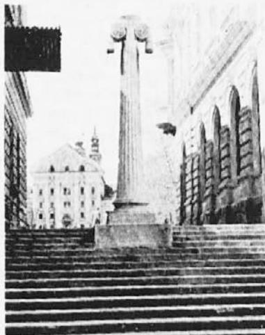
Plečnikov svetilnik — v ozadju Uršulinke (Ljubljana)