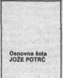
Osnovna šola JOŽE POTRC