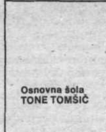
Osnovna šola TONE TOMŠIČ