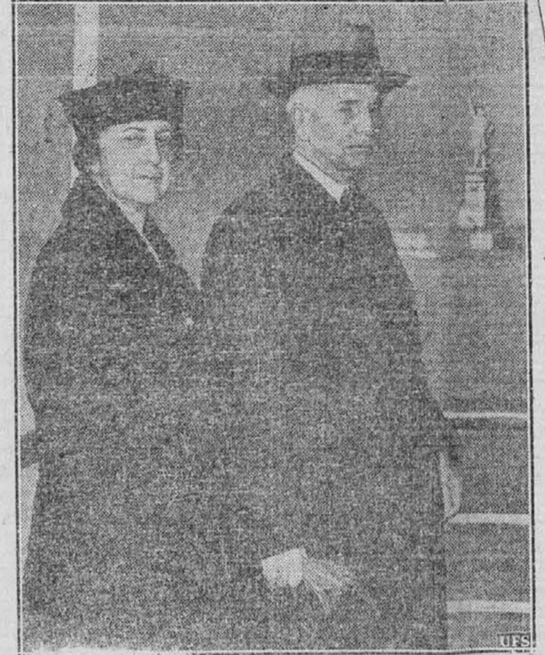
Državni tajnik Hull in njegova soproga, ko sta se nedavno vrnila iz Lima, Peru, kjer se je vršila vseameriška konferenca. V ozadju je videti kip Svobode.

sredstvo isti tisk pri dopove- dovanju ljudem, katera misel- nost je prava in koristna za posameznika, za občine, na- rode in države. Svobodomiseln- ci, komunisti in socialisti ne- pretao s tiskano besedo do- kazujejo, da je vera humbug za človeka, norčujejo se iz onih, ki so še verni in zvesti Bogu. Ali ni tudi nas katoli- čanov dolžnost, da potom ravno istega sredstva, potom tiska pobijamo te napade, la- ži in neresnice, ki jih širijo nasprotniki s tiskom proti ka- toličtvu? Da, to je naša dolž- nost. Zato pa jačimo katoli- čani svoj tisk. Glejmo, da mu napravimo prsto pot v vsako slovensko hišo v Ameriki, da bo potom svoje tiskane besede, kadarkoli potreba zavra- čal nasprotna napade in nauke. V tisku je naša moč. Tisk je naša največja sila. Množimo in ojačujemo naš tisk, ker ta je nosilec, na ka- terem potuje katoliška misel- nost.