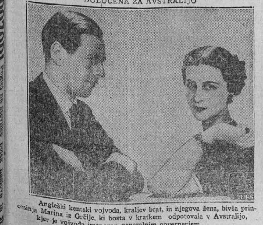
Angleški kentski vojvoda, kraljev brat, in njegova žena, bivša prin- cesa Marina iz Grčije, ki bosta v kratkem odpotovala v Avstralijo, kjer je vojvoda imenovan generalnim guvernerjem.