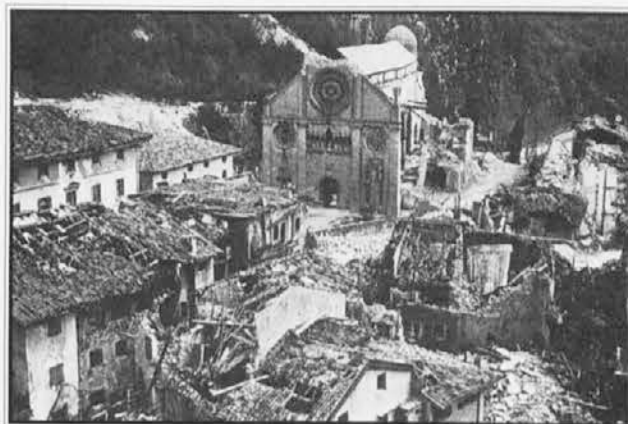
HUMEN, 7. maja 1976: središče prestolnice potresa

Tedanja Slovenija - bila je še socialistična in jugoslovanska - je velikodušno priskočila na pomoč potresnim krajem naše dežele, čeprav je bila v tolminskem, kobariškem in bovškem kotu sama precej prizadeta. To je bila z njene strani daljnovidna politična gesta in seveda veliko človekoljubno dejanje. To je nedvomno prispevalo k vse boljšim odnosom med našo deželo in Slovenijo, kar se pozna tudi danes. Če so danes neka politična trenja med Slovenijo in Italijo, gotovo ni za to kriva naša dežela. Nasprotno: še danes igra naša dežela med Rimom in Ljubljano pozitivno in pomirjevalno vlogo.