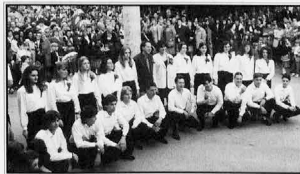
DOLINA: parterji in parterce na dolinskem vaškem trgu

V torek, 7. maja, se je s podiranjem maja končala Majenca, ki je tudi letos privabila v Dolino veliko število obiskovalcev. Praznovanja so se pričela v petek. Istega dne je bila tudi pokušnja domačih vin. V soboto so