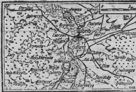
Die Festung Dubno.

Zavezniške čete so zavzele drugo trdnjavo v volhynskem ozemlju Dubno, katerega zemljevid v boljše razumevanje uradnih poročil da-