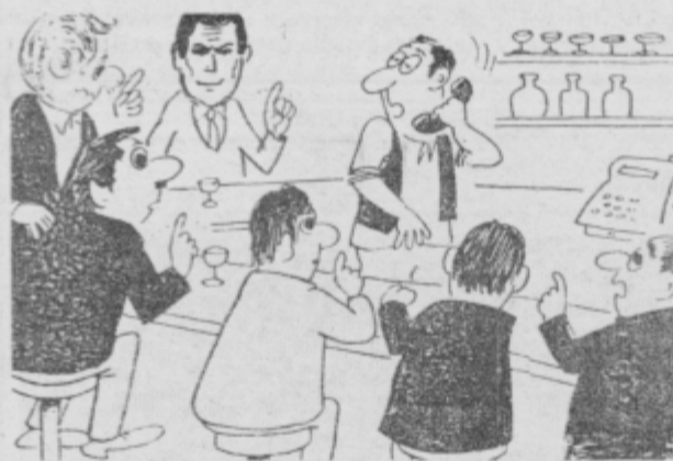
Res gospa, vi ste že tretja, ki to sprasuje. Tudi vam moram odgovoriti enako: vas mož ne martinuje pri nas! Sicer pa tako nimamo nobenega gosta več in pravkar zapiramo.

MOŠKI: Ne brskajte po preteklosti. Nemirni dnevi. Hitro boste ozdraveli. V veselju je moč. Premalo časa imate zase. Nobeno spoznanje ni dokončno. Globoka misel. Nekdo misli na vas. Zobo zdravnika potrebujete. Sreča.