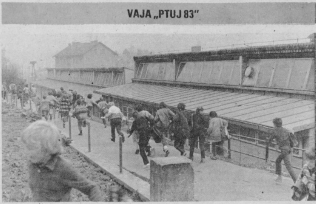
VAJA „PTUJ 83“

Med drugim so se dogovorili in dosledno tudi izvedli, da je bil v soboto, — na dan vaje, prostovoljni delovni dan, kar je brez dvoma prispevalo tudi k stabilizacijskim naporom. Vse dejavnosti in strukture, udeležene v vaji, so nosile tudi svoj del stroškov vaje. S tem so omogočili, da se je tako pomembna vaja z