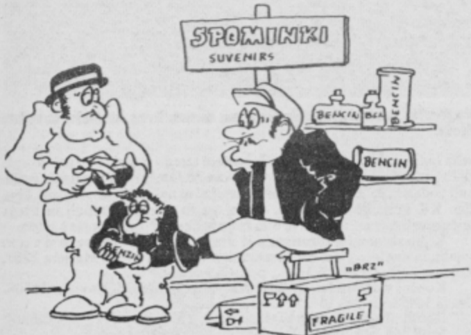
V pripravah na razstavo turističnih spominkov v Ptuju.