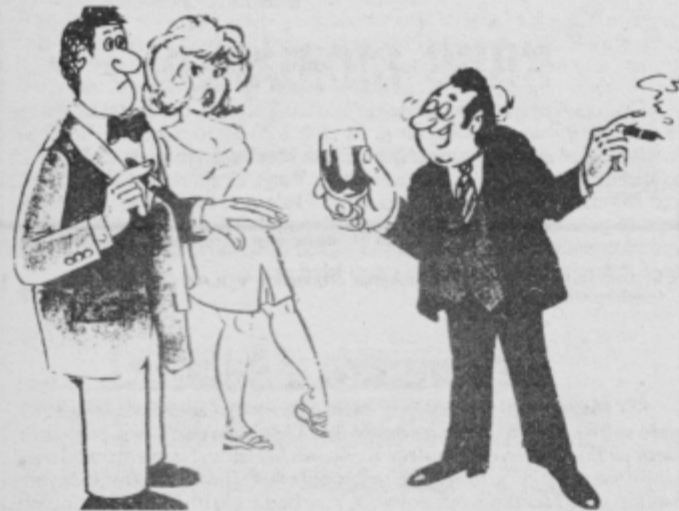
Ne vem kako to, čim bolj nazdravljaj stabilizaciji, tem bolj postajam nestabilen?