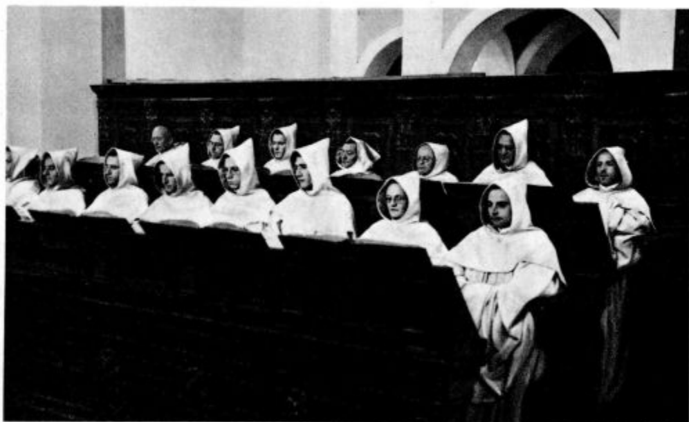
Beli menihi v koro pri bogoslužju (Slična)

«To, kar danes nekateri naglašajo kot nekako našo predpravico, je prvotno bilo skupno vsem redovom. Šele, ko so si novejši redovi pričeli prevzemati posebne smotre ter z vidika teh, bi rekel, bolj »dejavnih«, aktivnih vzorov motriti duhovno življenje, je javna, skupna, slovesna služba božja pri njih vedno bolj začela stopati v ozadje. Nekateri redovi je pa sploh nimajo. Novi vek je pač prinesel svoje potrebe in spričo teh novih zahtev so ustanovitelji ali reformatorji