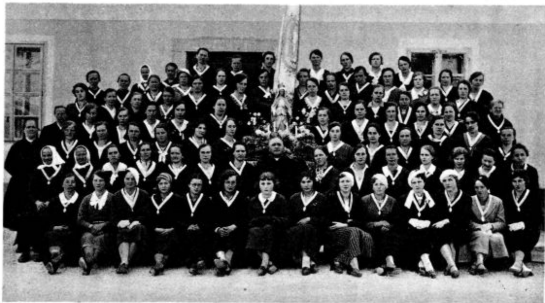
Mar. družba v Dobu v eharisličnem letu 1935