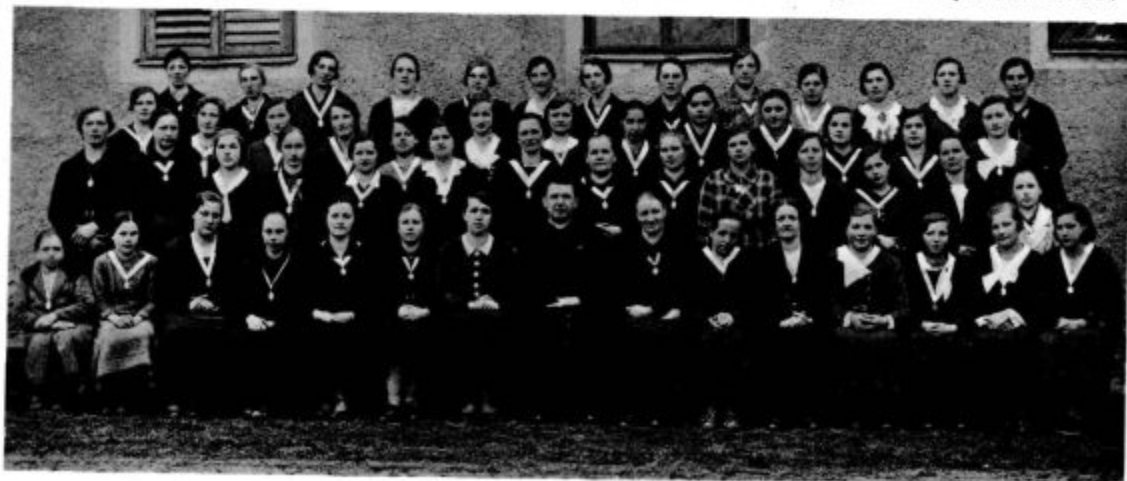
Dekliška Mar. družba v Št. Gotardu

Bil je na vrsti evangelij o farizeju in cestninarju. Kako zelo se je čutila Zoranka sorodna temu hinavcu in licercu. Kako zavisti vreden se ji je zdel grešni cestninar, ki svojo malovrednost spozna in prizna. Hudob-