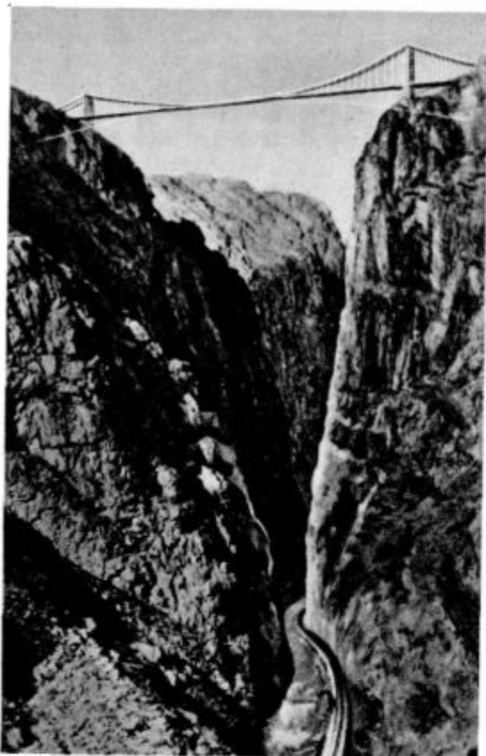
Najvišji mostna svetu. (Colorado, Sev. Amerika.) Ljubljanski škof se je čezenj peljal

mora priti, gledala huje in trje, kakor bi bila prva. Z jezo v srcu je šla gospodinja proč, od nje, ki se ji je svoj čas zahvaljevala za njeno pomoč. Teže kakor kdaj poprej se ji je zazdelo breme, ki ga mora vlačiti. Ali se ga ne bo nikdar mogla otresti?