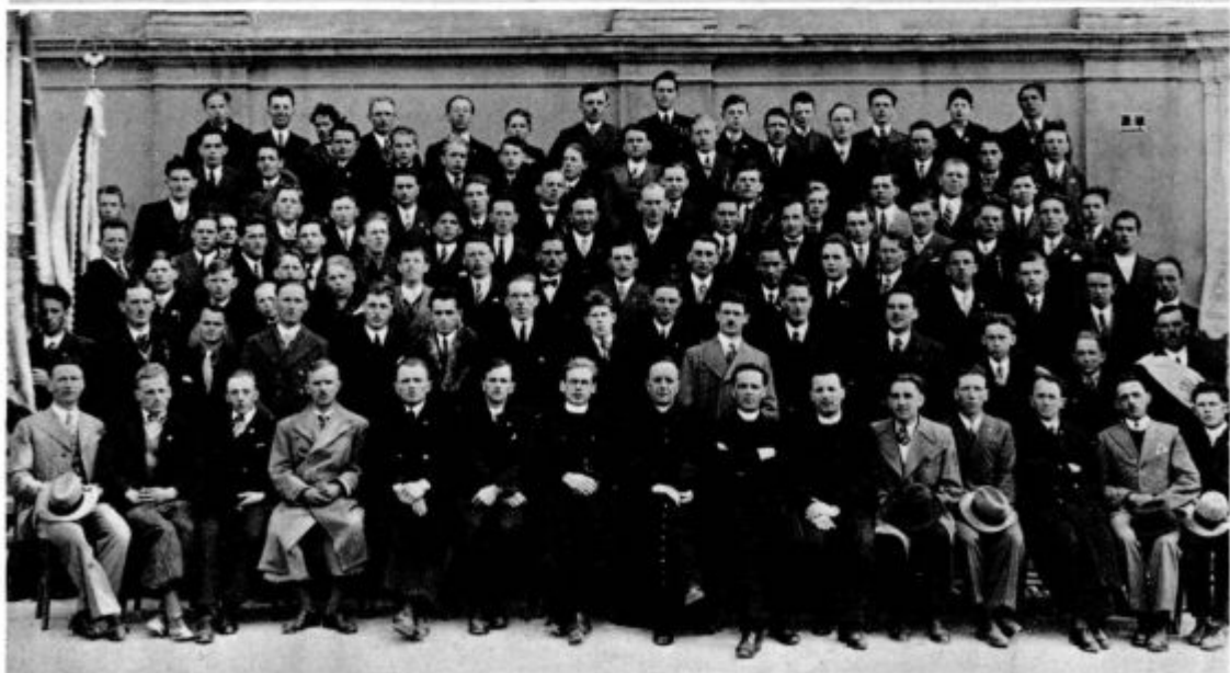
Dekanijska skupščina fantov Mar. dr. in K. A. v Kranju (I. in II. oddelek)