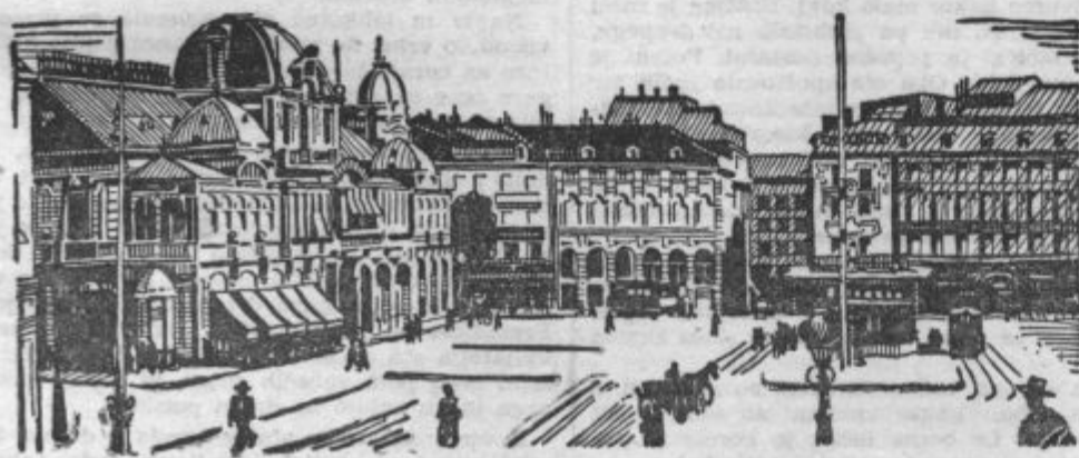
Nica, glavni trg

Kmetovalec ima od repice upoštevanja vredne koristi. Predvsem dobi od nje odlično jedilno olje. Po uredbi o obvezni setvi oljnih rastlin mora sicer oddati vse seme, ki ga pridelal na obvezni površini. Prevodu za pridelavo olja, vendar dobi poleg uradno določene cene za seme približno eno petino pridelanega olja po maksimalni cenf nazaj. Razen tega mu pripada polovica vseh iz semena pridelanih oljnih tropin, ki so zlasti za molzno živino odlično tečno krmilo, saj imajo več ko dvakrat toliko beljakovin in maščob kakor pšenični otrobi. Tako pridelal kmetovalec doma najboljšo maščobo za prehrano svoje družine in izvrstno tečno krmilo za živino.