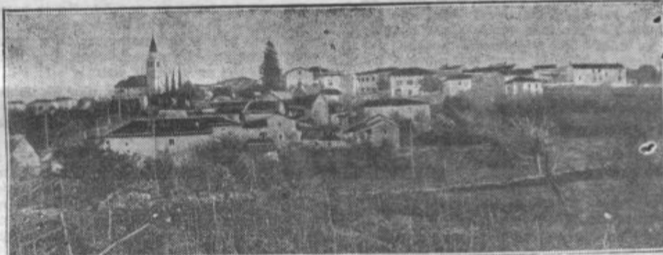
Pogled na Dutovlje, priljubljeno letovišče Tržčanov