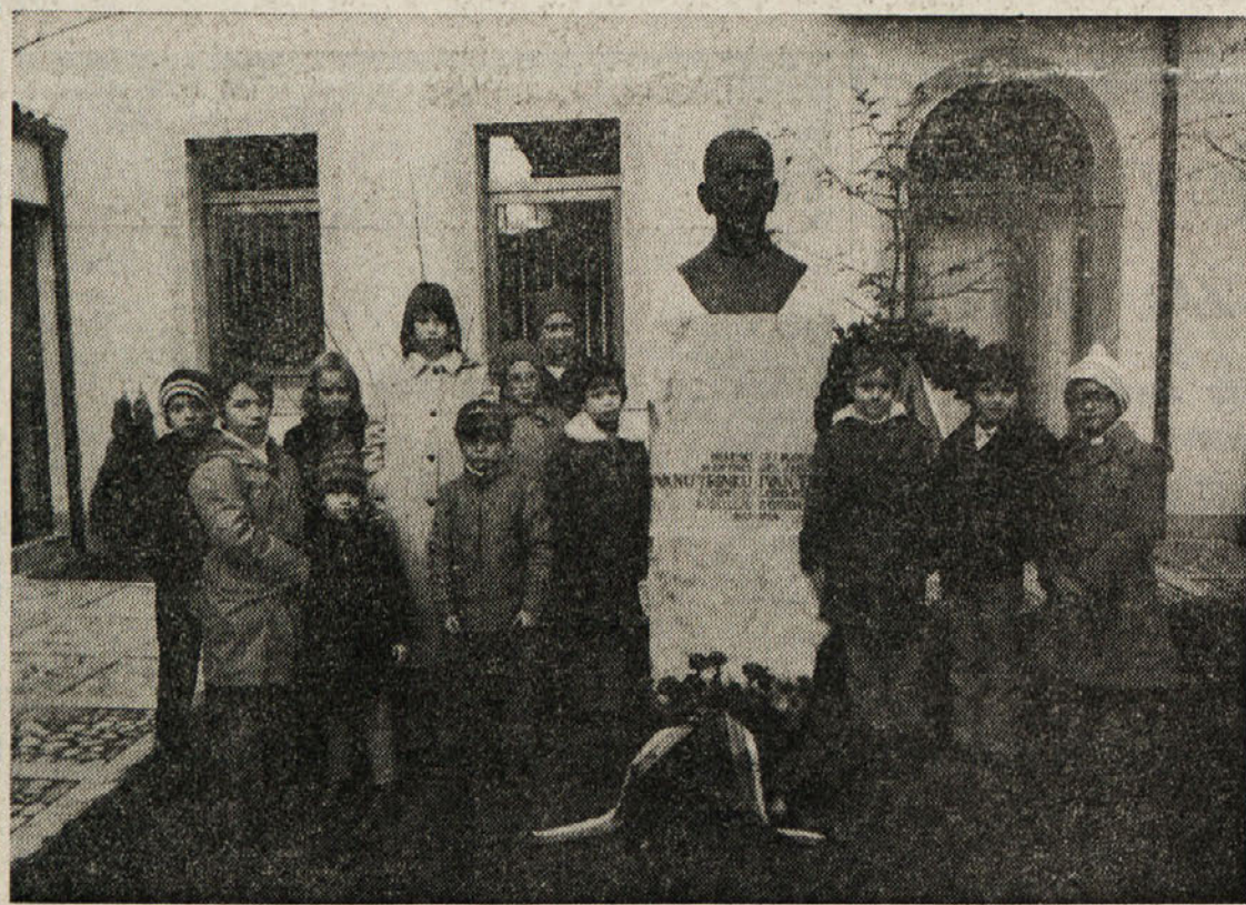
Z odkritja Trinkovega doprsnega kipa v Čedadu: otroci osnovne šole «I. Trinko iz Ricmanj pred spomenikom