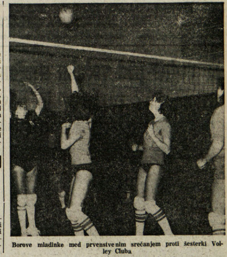
Borove mladinke med prvenstvenim srečanjem proti šesterki Volley Cluba

NOGOMET ZAOŠTALA TEKA A LIGE Milan - Napoli 12. decembra MILAN - Prvenstveno tekmo prve italijanske nogometne lige, ki jo je sodnik prekinil v 50. minuti zaradi megla na milanskem San Siru med Milanom in Napoliem, bodo odigrali 12. decembra.