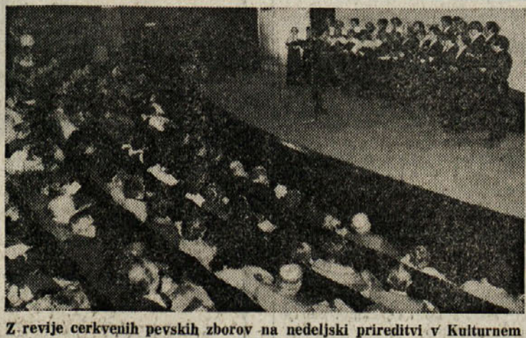
Z revije cerkvenih pevskih zborov na nedeljski prireditvi v Kulturnem domu

«Skenil je (Nixon) izmikati se sem in tja in se ob tem opirati na zelo meglene temelje, kakršni so privilegij izvršne oblasti in nujna zaupnost, medtem ko je ameriško ljudstvo hotelo vedeti samo to, kakšna je resnica... Upira se mi uporabljati zloglasno kraljico: «Ali bi bili vi voljni kupiti rabljen avto od Dicka Nixona?» Toda ljudje po vsej državi sprašujejo natanko po tem. General Haig ne ve o političnih zadevah čisto nič... Jaz preprosto ne morem verjeti, da bi (Nixon) poslušal Zieglerja. Kaj takega bi bilo po mojem naravnost katastrofalno. Spet ni v tem ničesar osebnega, gre le za to, da se Ziegler ne spozna na politiko.»