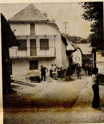
Obnova se je pričela

nad glavno, ne pa hišo kot je bila ta." Še enkrat je s pogledom objel raztrgane pode in porušene stopnice in s sklonjeno glavo zapustil hišo. "Kaj vam ne bodo dali nobene pomoči?" sem mu sledila na cesto, "Kaj pa ves denar, ki se zbira doma in v tujini za pomoč prizadetim?" "Seveda se zbira denar," je rekel, "vendar prve bodo na vrsti bolnišnice, zdravstveni domovi, šole in druge javne zgradbe." Iz karavana za hišo je prišla mlada žena z dojenčkom v naročju. "Saj so nam veliko pomagali," je rekla, "v nekaj urah je bila tu vojska z vsem potrebnim in iz vse države so poslali karavane in šotore. Mi smo zaradi otroka prvi dobi-