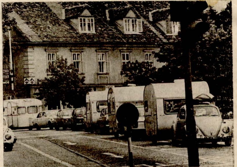
Dolenjska cesta v turistični sezoni.