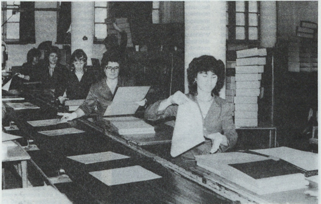
Ročno kaširanje platnic registratorja "HERMES"