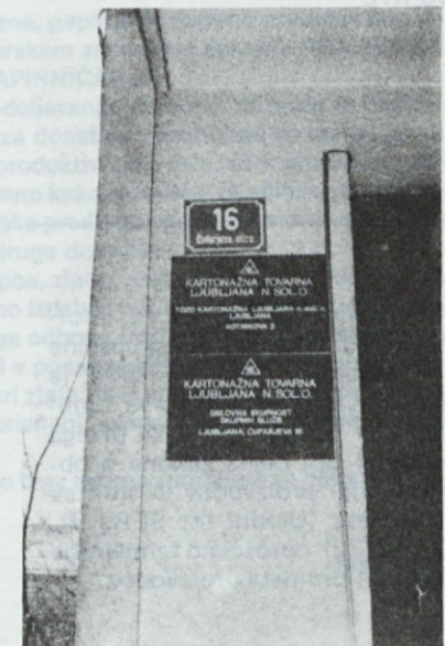
Do kdaj tako?

te, časopisa Absatzwirtschaft). V Jugoslaviji takih raziskav doslej še ni bilo, vendar pa poznamo več poskusov strokovnega izražanja kompetence, oz. posebnih sposobnosti delovne organizacije. Često se formulacija kompetence kaže v obliki slogana, npr.: V sodelovanju z naravo (Fructal), Treba je znati z lasmi (Ilirija — Vedrog). Zelo polnokrvna se mi zdi npr. formulacija nemške firme Bayer: Varovati življenje in zdravje, lajšati bolečine in lakoto, dobavljati orodje za oblikovanje življenja.