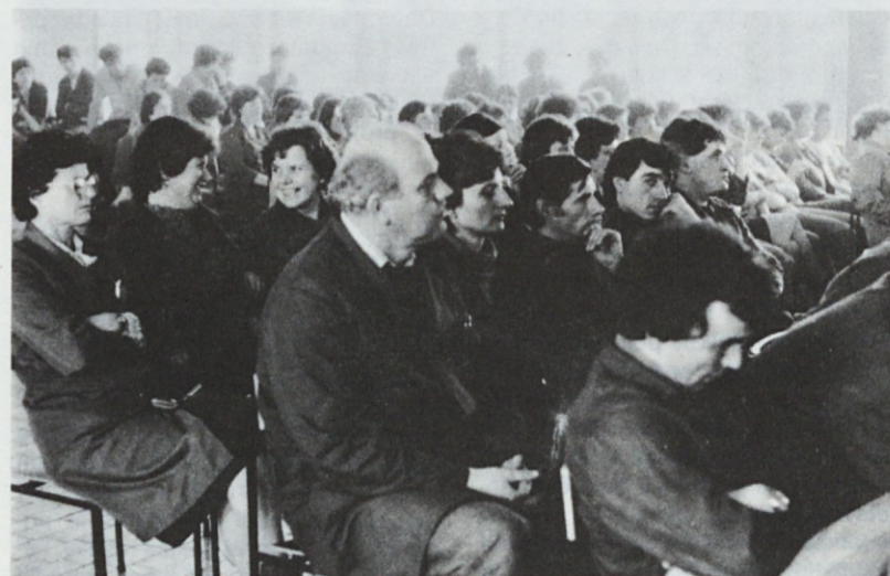
Na zboru delavcev tozda Kartonažne ob obravnavi skupnih temeljev nadaljnjega razvoja

Novo vložena sredstva in dosedanje kapacitete naj bi omogočale delo približno takemu številu delavcev kot jih je sedaj. Gibanje števila zaposlenih v temeljnih organizacijah bo različno. V temeljnih organizacijah Kartonaža, Lepenka, Valkarton, Kuverta, Embalažni servis, Tika in Sigma naj bi se število zaposlenih povečalo, v ostalih TOZD pa zmanjševalo. Proizvodne kapacitete in zaposleni delavci naj bi v srednjeročnem obdobju 1986—1990 uresničili naslednje povprečne letne stopnje rasti: