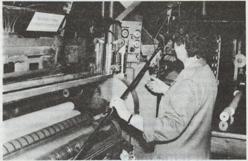
Izdelava biro zvitkov na avtomatu v tozdu Papirna konfekcija

Z vodstvi TOZD in njihovimi tehničnimi kadri bomo najtesneje sodelovali.