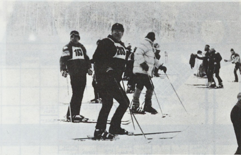
Še nekaj utrinkov z letošnjega prvenstva DO KTL v veleslalomu