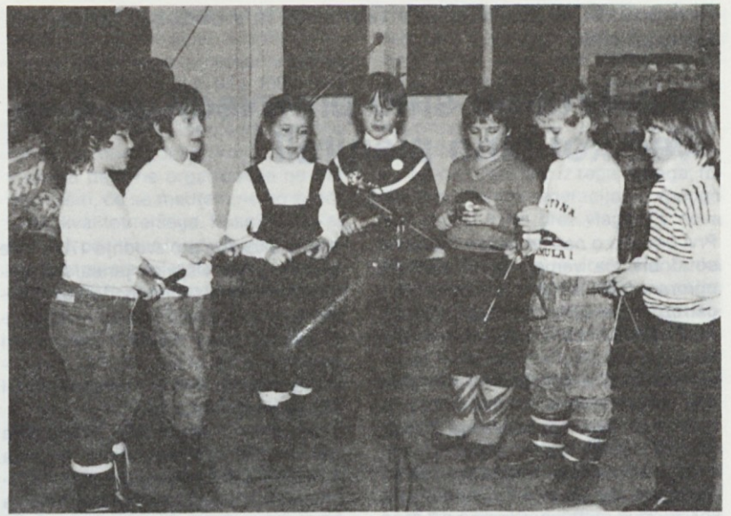
Foto vest: Otroci osnovne šole Ledina so pripravili kulturni program našim delavkam ob "dnevu žena"