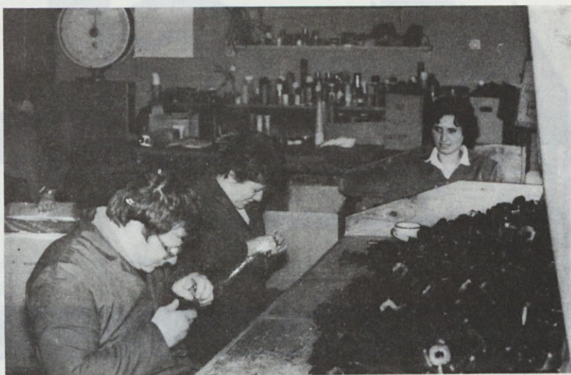
Obrezovanje izdelkov iz plastike – Jelplast

Osební dohodek in skupna poraba za delavca znaša za delovno organizacijo din 94.000 in se je povečal z indeksom 199, medtem ko je TOZD Kuverta dosegla din 161.000, s tem, da indeks povečanja znaša 203. Najnižjo vrednost po tem kazalcu izkazuje zopet Jelplast, z din 73.000. Drugi z osebnim dohodkom in skupno porabo na delavca pa je z din 99.000 Papirna konfekcija Ljubljana.