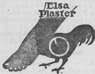
Kdor svojih kurjih očes ne odstrani, mu je vsaka pot muka ter slabi z bolečino tudi celo telo. 502

Gradec, 12. septembra 1917: 82, 84, 11, 69, 8 Trst, 5. septemb. 1917: 57, 31, 85, 71, 72