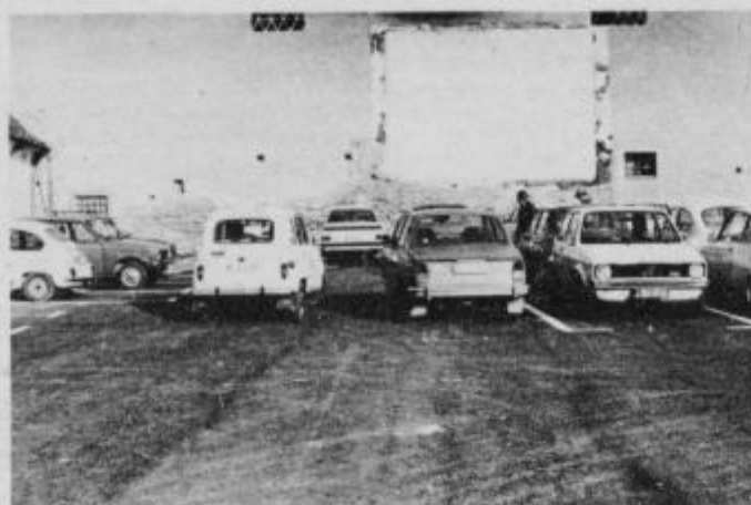
Ta posnetek je bil napravljen na Katarinin sem, ko je bilo v Ptuj največ prometa in zato tudi drena na parkiriščih. Kot se vidi na posnetku, sta dva voznika nepravilno parkirala in zaprla izhod drugim

Vozniki si zato želimo več reda pri parkiranju avtomobilov, da bomo tako lahko izkoristili vsak prostor, ki je namenjen za parkiranje. Besedilo in posnetek: Konrad Zorec