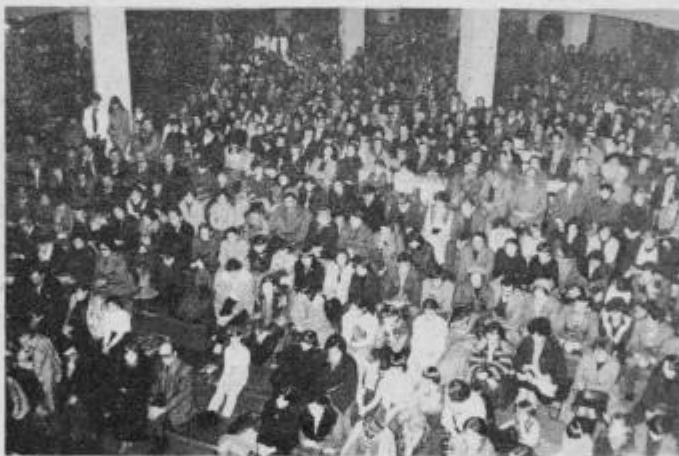
Proslave v avli CSUI se je udeležilo nad 2000 občanov