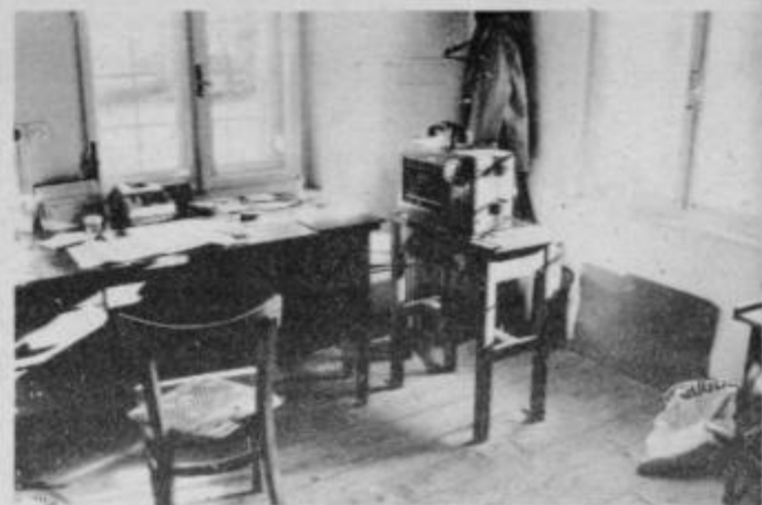
Notranjost pošte na Polenškaku z zastarano induktorsko telefonsko centralo. S samoprispevom bodo zgradili novo pošto s sodobno telefonsko opremo