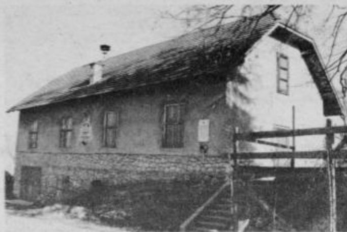
Gasilski dom na Polenškaku je potreben obnove

V nedeljo, 7. decembra glasujemo: — za razvoj svoje krajevne skupnosti, — za srečo in varnost naših otrok, — za lepo in zadovoljivo življenje naših staršev, dedkov in babic!