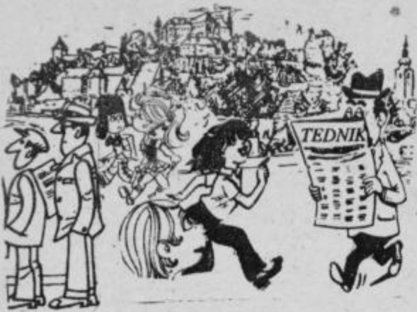
Stric, a ste prebrali tisto, da morate v nedeljo glasovat za samoprispevek?