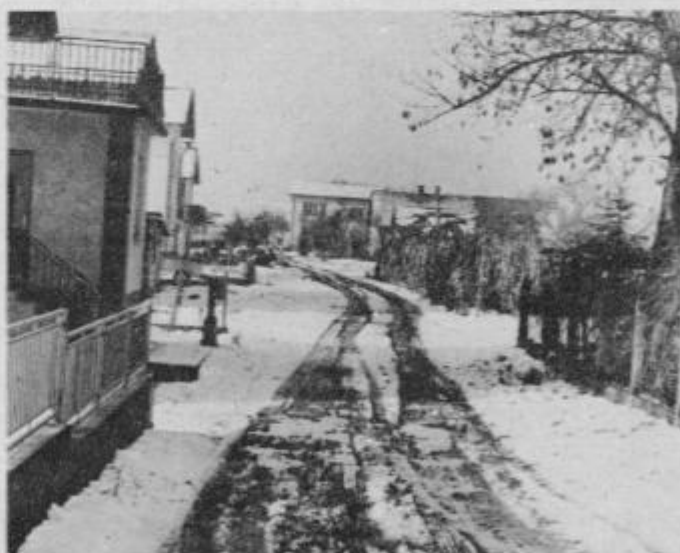
V programu KS je tudi asfaltiranje Gromove ulice