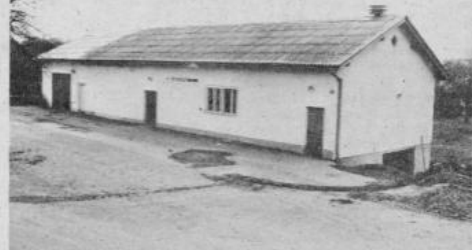
V domu gasilcev, ki so ga krajanji Spuhlje zgradili z lastnimi sredstvi in delom, bodo uredili tudi prostor za trgovino, da bodo tako omogočili boljše oskrbo prebivalstva z živilskimi potrebščinami

ni, da vsi krajanji vedo kako močno so odvisni drug od drugega in kako potrebno je sodelovanje pri reševanju skupnih nalog. Dokaz za to je, da cesta obvoznica ne bo tekla po najrodovitnejših njivah, ampak po stari sedanjih cesti, otrokom ni potrebno hoditi v šolo v Markovce, ampak so ostali v šoli Tone Žnidarič, napeljali so 40 telefonov, ogromno so dosegli pri organiziranosti in uveljavljanju samoupravnega sistema ter na področju splošne ljud-