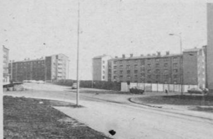
Na tem mestu, med novimi stanovanjskimi bloki ob Ulici Borisa Kraigherja, bo prihodnje leto zrasla velika blagovna hiša za boljše preskrbo prebivalstva

Romana Ercegovič, 2/a, OŠ Olga Meglič, Ptuj