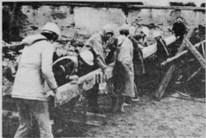
Člani KK Drava pri delovni akciji za zagotovitev dela potrebnih sredstev

V prejšnjem tekmovanju so se njihove selekcije prebile do polfinala, to pa je pravgotovo spodbuda za nadaljnje delo. Strokovnega dela z mladimi ni brez ustreznih in strokovno usposobljenih voditeljev in trenerjev. Tako skrbijo tudi za redno pridobivanje novih in izpopolnjevanje sedanjih trenerjev