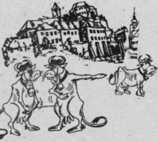
Poglej jo važičko, sedaj ko je na Katarininem sejmu sredi Ptujia pobegnila mesarjem