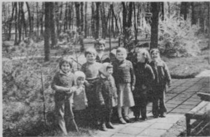
Občani KS Kidričevo, glasujte ZA, da bodo obrazki vaših otrok in vnukov ostali tudi za naprej nasmejani

V naselju Kidričevo je glavna naloga - sofinanciranje zgraditve centralne kotlovnice za ogrevanje stanovanj. Pri Kungoti bodo največ samoprispevka namenili za obnovo prosvetnega doma. V Apačah bodo skoraj dve tretjini samoprispevka namenili za asfaltiranje ceste