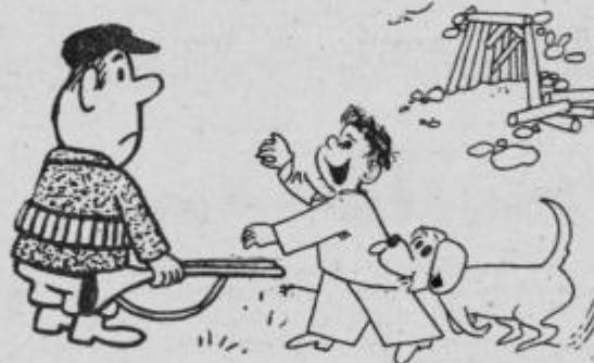
Stric lovec, ta pes je sigurno stekel, saj je za mano stekel...