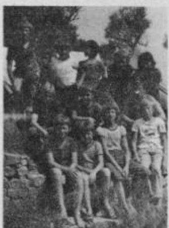
Skupina učencev na taborjenju v Valovinah pri Puli. Med njimi nekaj dobrih športnikov.

Društvo je v tem letu dobilo tudi svoj prostor, ki se nahaja v nekdanji pralnici, kjer bo arhiva društva in prostor je primeren za sestanke. Z dodelitvijo prostora bišve pralnice še ni bilo vse rešeno. Prostor je bilo treba očistiti in obnoviti. Z mi-