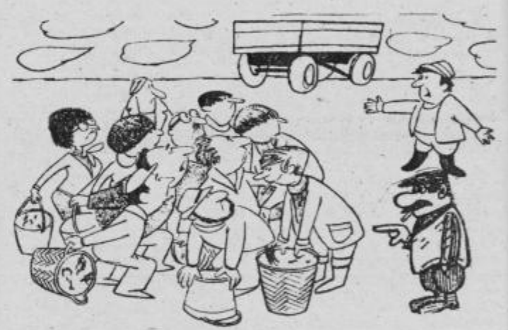
Vse kar je prav, dragi občani. Koruzo, ki jo paberkujete na kombinatovih njivah boste morali plačati!