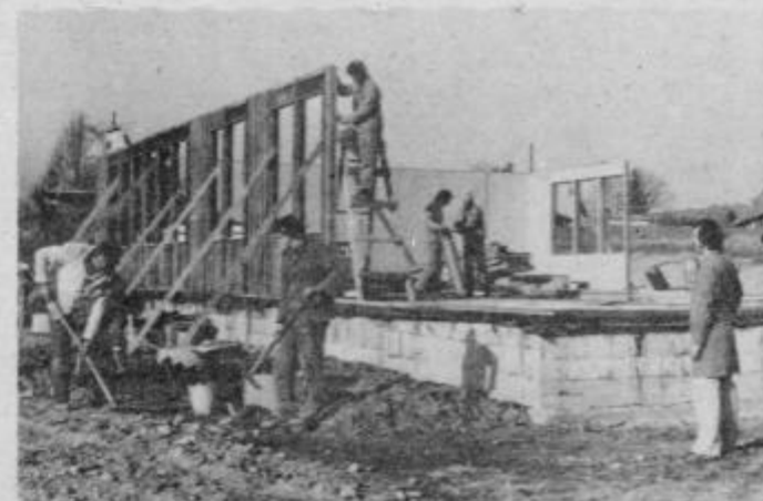
Dom občanov KS Bratje Reš zadnje dni hitro raste

V tej krajevni skupnosti kjer je še veliko potreb kot so skupni prostori, urejena oskrba, električna energija, voda, urejene ulice in ceste, javna razsvetljava in kanalizacija - pričakujejo da ne bo krajanja, ki v nedeljo, 7. decembra ne bi uveljavil svoje pravice, ki mu jo daje ustava in se izrekel o planu razvoja krajevne skupnosti v naslednjih petih letih. Gotovo si vsak želi, da bi bilo marsikaj bolje urejeno kot je sedaj zato bo nedeljsko glasovanje tudi potrditev programa, ZA pa porok, da bo v najkrajšem času veliko teh potreb in želja tudi uresničenih.