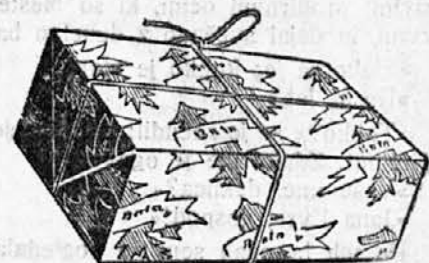
PRAKTIČNO DARILLO VSAKEGA RAZVESEL

Izkoristite naše znižane cene obutve za božično darilo. Opremili smo naše prodajalnice z vsakovrstno obutvijo in smo pripravljeni, da Vas strokovno postrežemo in da Vam dobro priporočimo