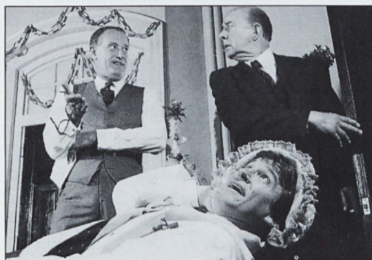
Fotografije s praizvedbe uprizoritve "To imamo v družini"