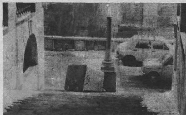
DELO KOMUNALNEGA PODJETJA LJUBLJANA