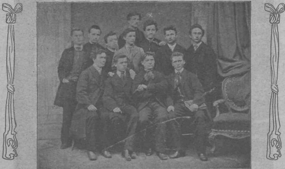
Sedmošolci-Alojzniki na ljubljanski gimnaziji leta 1868.

Visoki cerkveni knez ni nikdar pozabil na svojo rodno vas in na leta mladosti, ko je še koš dijak rad zahajal na dom in ondi zbranim domačinom goreče pridigoval na vogalu domačega skednja. Slika njegove rojstne hiše, ki jo tukaj vidimo, v pomanjšani obliki visi