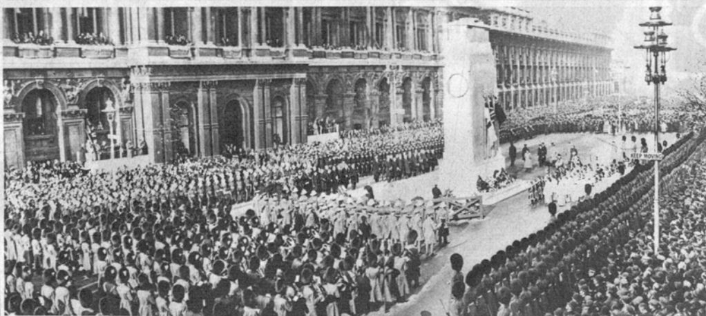
Proslava 15. obletnice premirja pred grobom neznanega vojaka v Londonu.