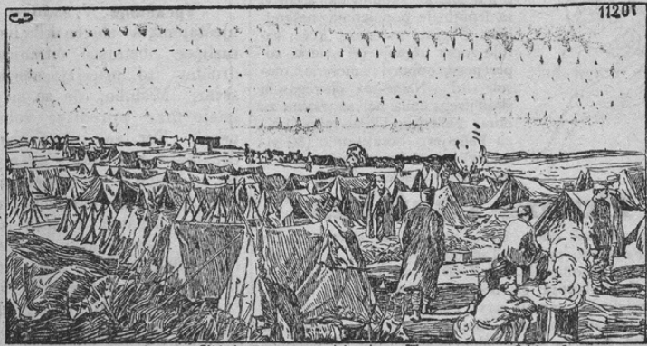
Lager der geflüchteten serbischen Truppen auf Korfu.

Za časa zmagovitih naših bojev na Srbskem in v Albaniji bilo je jedro srbske armade uničeno. Le par tisočev nam tako strupeno sovražnih, vendar pa junaških čet zamoglo se je rešiti pred uničenjem. Grozovita kazen božja zadelala je srbsko kraljemorilsko državo; vsled vseslovanskega fanatizma voditeljev te zločinske države moralo je srbsko ljudstvo skoraj poginiti. Listi prinašajo grozovite posameznosti o koncu poražene srbske armade. Na tisoče napol otročjih mladeničev, preoblečenih v srbske uniforme, pomrlo je od lakote in napora. Kakor rečeno, rešilo se je le par tisočev srbskih vojakov. Njih zavezniki an-