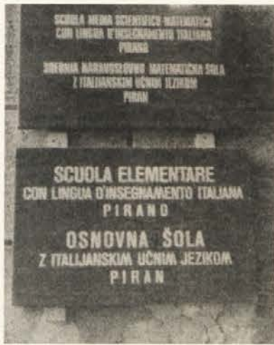
Dvojezični napisi na šolah...

V času med obema vojnama je bilo to ozemlje pod Italijo. Fašistična Gentilijeva šolska reforma je do leta 1928 izbrisala še zadnje slovenske šole. Po zmagi nad fašizmom so na spornem ozemlju cone B (obalne občine in Buje) po mednarodnem sporazumu ostale tudi šole z italijanskim učnim jezikom. Prav tako so te šole ostale tudi na področjih izven cone. Po razmejitvi ozemlja po letu 1953 je bil med Italijo in Jugoslavijo sklenjen dogovor, ki je reguliral pravice izobraževanja na obeh straneh meje. Pred 11. leti so bila določila sporazuma vnešena tudi v dokončni Osimski sporazum med obema državama. Podlaga sporazuma je recipročnost, kajti na obeh straneh meje je narodnostno mešano ozemlje. Za izvajanje