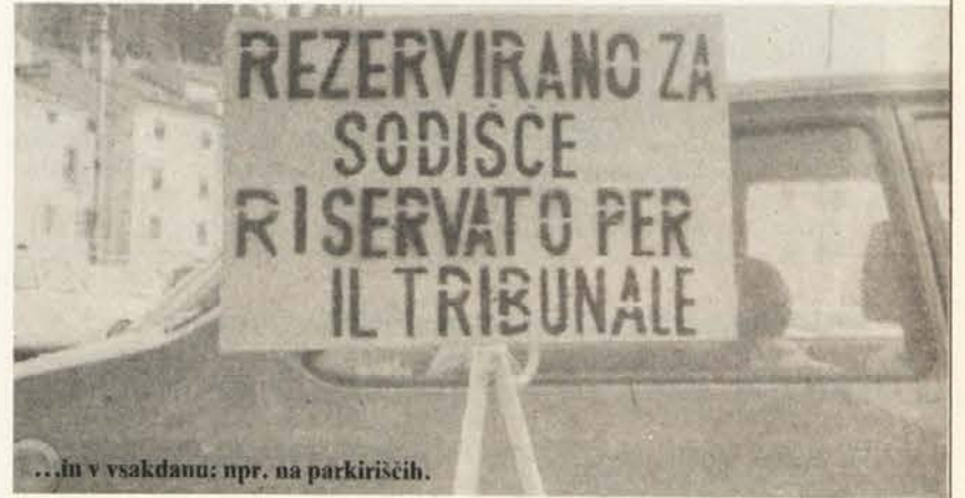
...in v vsakdanu: npr. na parkiriščih.

2. V vseh vzgojnoizobraževalnih ustanovah se učijo tudi drugi jezik – jezik okolja (Umgangssprache). Obvezno! Ni se treba niti prijavljati, niti odjavljati. V slovenskih šolah imajo tedensko po dve uri italijanščine, v italijanskih pa na izrecno zahtevo Zveze Italijanov/Unione degli Italiani po tri ure slovenskega jezika tedensko. Tako se sploh ne more zgoditi, da nekdo vsaj pasivno ne bi obvladal drugega jezika.