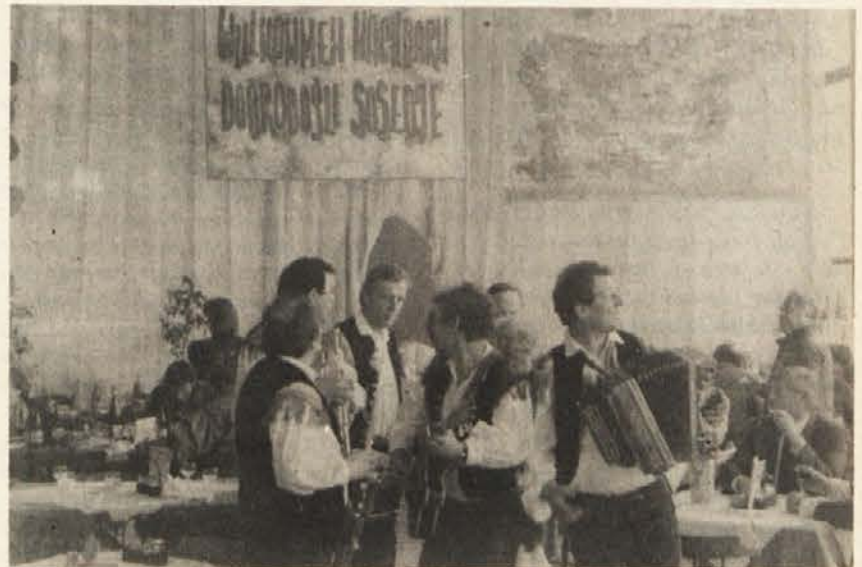
KUD Karol Pahor je igral v paviljonu in na prireditvah

Mikavnost prireditev je bila v tem, da so poleg folklornih nastopov predvajali tudi video-film o lepota slovenske turistične ponudbe, ki jo je z ustreznim propagandnim materialom podkrepila agencija Cartrans iz Celovca.