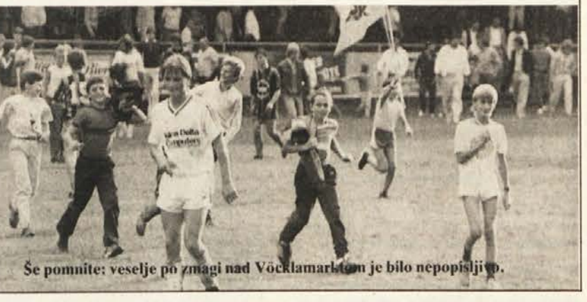
Še pomnite: veselje po zmagi nad Vöcklamarkom je bilo nepopisljivo.