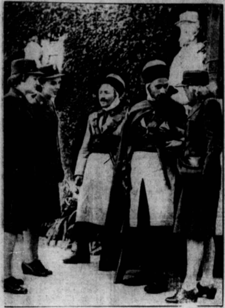
Američanke, članice naše armade, v francoski severni Afriki, ki so sveljavljajo v svojo novo službo.