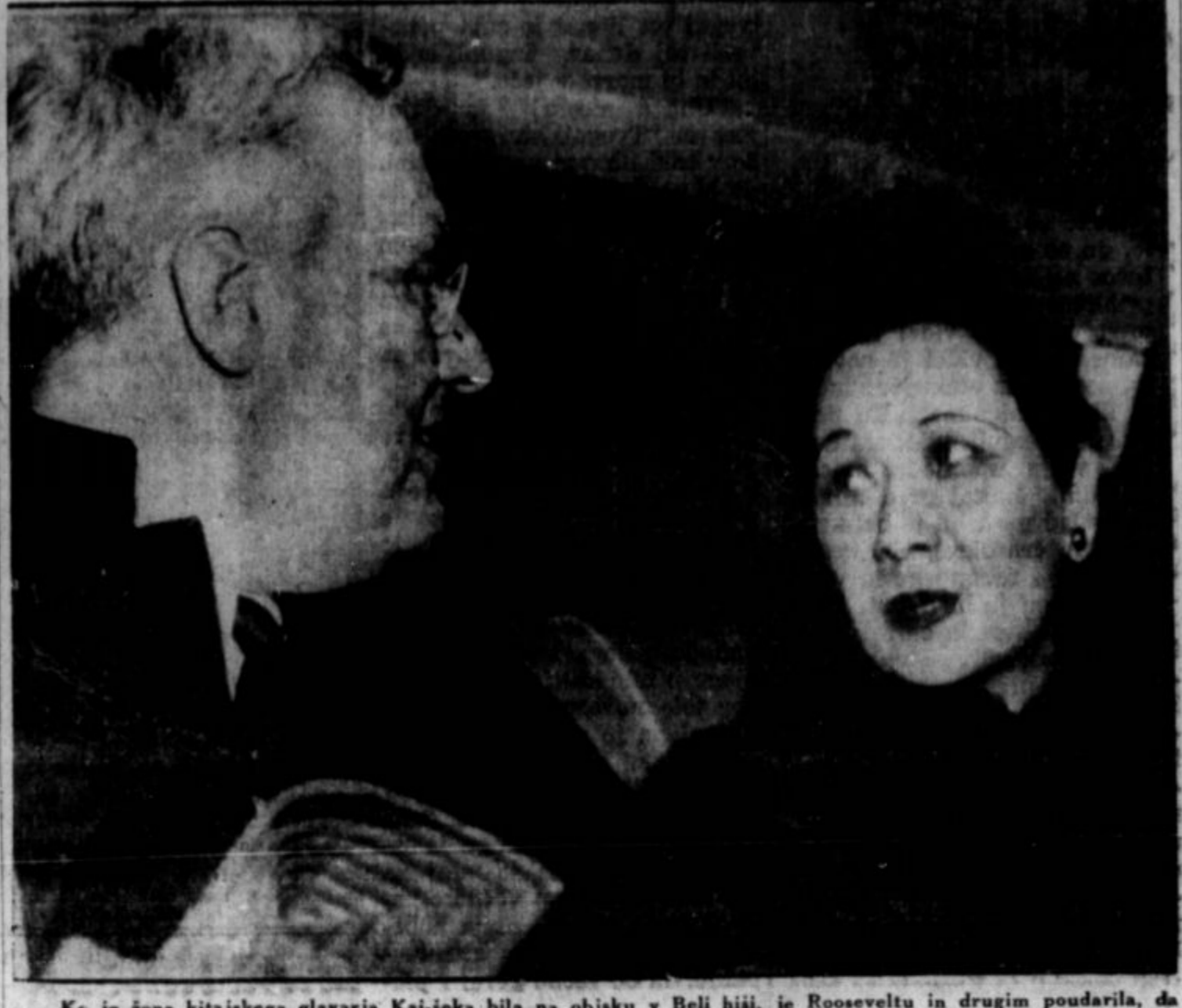
Ko je čona kitajskega glavarja Kai-šeka bila na obisku v Belj hiši, je Rooseveltu in drugim poudarila, da Kitajska vztraja v vojni še sedmo leto. Omenila je ob enem, da ni s pomočjo zaveznikov nič kaj zadovoljna. Vendar pa si Zed. države prizadevajo, da Kitajski pomagajo kolikor največ morejo. Na gornji sliki sta Roosevelt in pa madama Kai-šek, ki se tu zdravi in ob enem pa deluje, da bi dobila Kitajska od ameriške lend-lease več pomoči kakor jo je doslej.

Cemu Rusija ne da svojih prerij v Sibiriji ameriškim letalcem za bazo, s katerih bi napadali Japonsko? Cemu Rusija sploh ne gre v vojno z Japonsko? To in še marsikaj