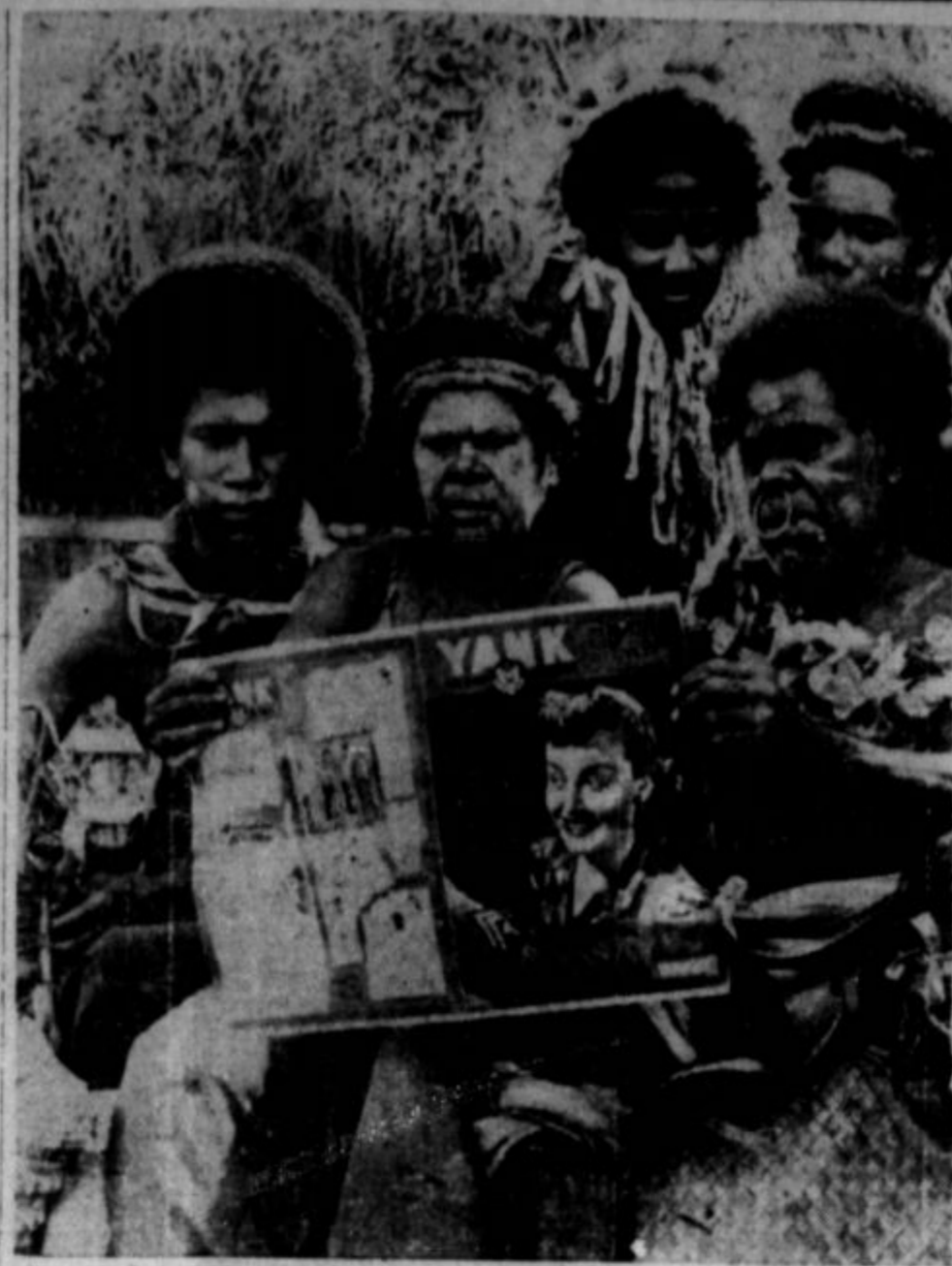
Slika iz Afrike. Po sporočilih ameriškega urada za vojne informacije pomeni, da domačini novice iz naših virov z zadovoljstvom čitajo zato, ker so resnične. Tudi ameriški način reklame jim ugaja.

Naivejšo trgovino pa ima Španija z Nemčijo in mnogi ameriške pošiljatve generalu Francu kritizirajo, ker se boje, da jih daje doberšen del Nemčiji.