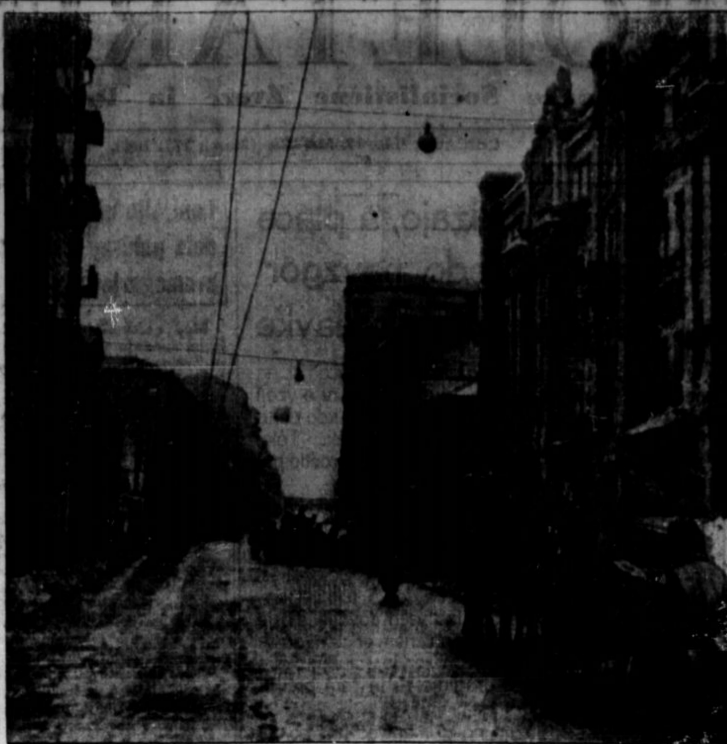
Karkov je četrto največje sovjetsko mesto. Sovjetska armada ga je vzela Nemcem v ofenzivi skozi to zimo s silnimi žrtvami, a vzela ga je. Nemiko vrhovno poveljstvo se je zavzelo to strategično točko vzeti nazaj, in tako so se tam zadnje dni godile grozovite bitke, ki imajo primer le iz bitk pred Stalingradom in Leningradom.

Ko v Moskvi vso to politiko darlanizma v Afriki in v Špa-