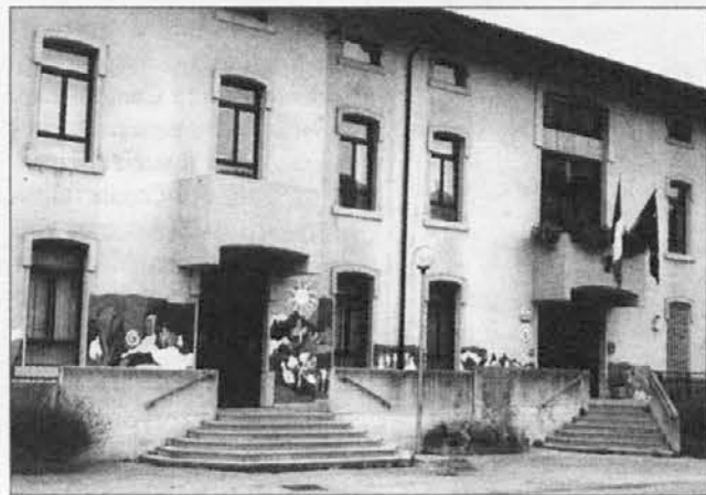
La sede municipale di S. Leonardo

Non si tratterebbe ancora di "Stato federale" ma sarebbe il primo passo per arrivarvi, considerato che è prevista "la partecipazione di rappresentanti delle Regioni, delle Province autonome e degli enti locali alla Commissione per le questioni regionali", l'annuncio di quella che potrebbe diventare la Camera delle Regioni in sostituzione del Senato.