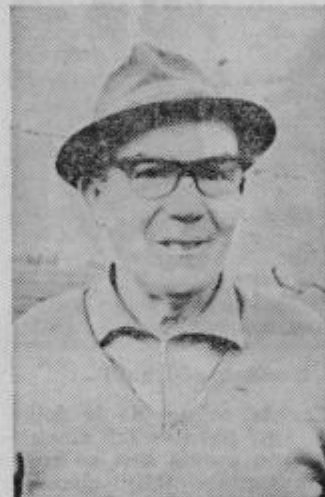
tovščini pa tudi med športnimi ribiči. Ribiški trnek namaka že polnih 23 let in ima polno resničnih ribiških doživljanj pa tudi v lovski družini Leskovec je včlanjen že 20 let. Te vrste razvedrilo mu še

Je tudi starešina lovske družine Leskovec ter dolgoletni blagajnik krajevne organizacije ZB NOV v Vidmu. Ne razume, zakaj je bil nekaterim borcem NOV ukinjen poseben občinski dodatek, še zlasti, ker življenjski stroški skokovito naraščajo, pokojnine pa vse bolj zaostajajo za cenami. Posledica tega pa je, da si morajo upokojujenci rezati tanjši kruh kot tisti, ki so še danes v rednem delovnem razmerju.