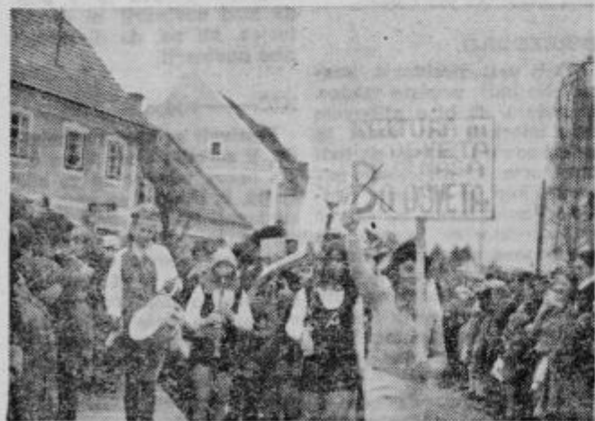
Prekinitev financiranja B programa na karnevalu

skupinami, ki so prikazovale aktualne dogodke v zvezi z devalvacijo dinarja (td. je bilo tudi mnogo kurentov in