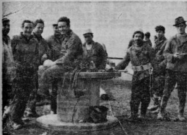
Domačini in monterji so si za trenutek oddahnili . . .

ter zaveje skozi rebri in osuše nekaj krp rodovitne zemlje. Morali bi čutili vprašaj, ki je namenjen jutrišnjemu ševu, marsikaj bi morali . . .