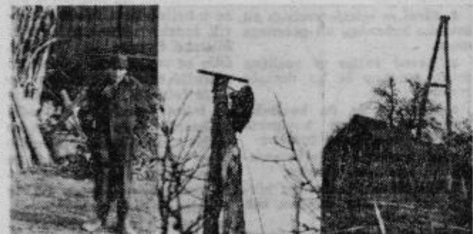
Jaka s svetilko, delo in tihožitje na tem delu Haloz

Leden veter je zapihal, tak, ki prepriha do kosti, možje pa so še krepkeje pljunili v roke. Dekleta so od nekod prinesle pletenko, potem pa